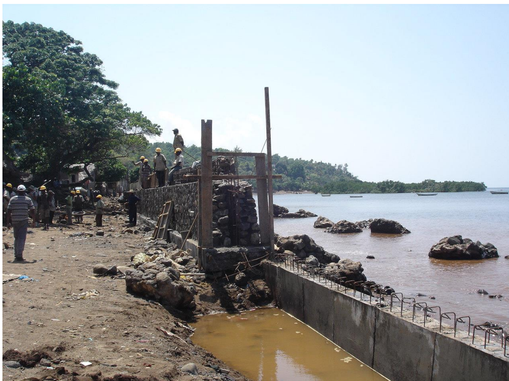
Figure 3 – Construction d'un mur financée par l'UE sur la plage de Bimbini