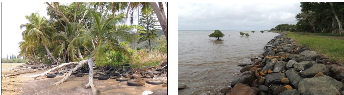
Figure 4 : aménagements de protection de la côte à Yaté

En Nouvelle-Calédonie, les préoccupations de plus en plus vives des populations du littoral concernant l'érosion côtière ont conduit les services du Gouvernement à créer en 2013 l'Observatoire du littoral de Nouvelle-Calédonie (OBLIC). L'érosion y est traitée sous trois angles : - le recul du trait de côte, - la mobilité des îlots sableux du lagon, - les aléas et risques de submersion (Garcin, Vendé-Leclerc, 2014). Le recul du trait de côte est la problématique la plus généralisée ; elle concerne les grandes îles (Ouvéa, Ile des Pins, Ile Ouen...) comme la Grande-Terre : Hienghène (Koulnoué), Ponérihouen (Tiakâ), Touho, Poindimié, Bourail (Poé), Païta (Karikaté) et bien sur Yaté où les dynamiques environnementales et sociales vécues et perçues sont représentatives du contexte calédonien et peuvent être éclairées par la situation anjouanaise. Aujourd'hui, les habitants de Yaté craignent que l'érosion de leur littoral entraîne la perte de lieux d'habitations, d'espaces vivriers et de certains espaces à valeur patrimoniale, notamment des lieux de sépulture de la période précoloniale. En effet, les initiatives privées prises pour défendre le trait de côte (plantations de palétuviers sur l'estran et de cocotiers en haut de plage, empilements de troncs parallèlement au rivage ou de pneus de voitures et de camions sur le haut de l'estran) se sont révélées peu efficaces (Fig. 4a).