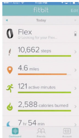
FIG. 2. L'APPLICATION FITBIT , ILLUSTRATION D'UN SYSTÈME « GÉNÉRALISTE » 13 .