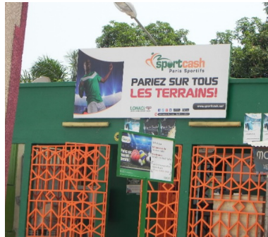
DE HAUT EN BAS, DE GAUCHE À DROITE : 1) SIÈGE SOCIAL DE LA LONASE À DAKAR. 2) SIÈGE SOCIAL DE LA LONACI À ABIDJAN. 3) KIOSQUE, POINT DE VENTE DE LA LONACI, DANS LE QUARTIER DU PLATEAU À ABIDJAN. 4) ENTRÉE D'UN CENTRE DE JEU À COCODY (PÉRIPHÉRIE NORD-EST D'ABIDJAN), « POINT DE VENTE AGRÉÉ » OÙ L'ON PEUT JOUER AU PMU, À DES PARIS SPORTIFS ET DES JEUX DE GRATTEGE. 5) ESPACE DE COURSE PLR (PENDANT LA RÉUNION, ON PEUT DONC PARIER PENDANT LA COURSE QUI SE DÉROULE GÉNÉRALEMENT EN FRANCE), À YOPOUGON DANS LA PÉRIPHÉRIE OUEST D'ABIDJAN. 6) PUBLICITÉ POUR LES JEUX D'ARGENT SUR LES MURS DES RUES D'ABIDJAN