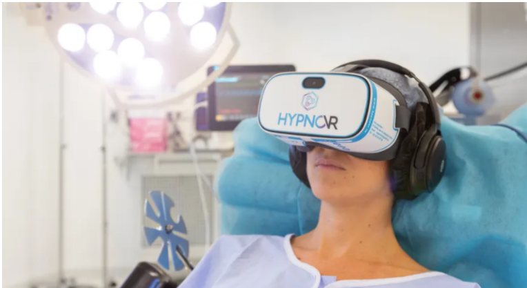
FIG. 1 HYPNO VR, STARTUP CRÉÉE EN 2016, PROPOSE D'ANESTHÉSIE LES PATIENTS PAR LE BIAIS DE L'HYPNOSE 11 .

Dans la vie quotidienne, les « bons » comportements sont souvent longs à acquérir (e. g. apprendre à bien doser l'insuline pour un diabétique). En effet, en cas d'erreurs, le coût pour les personnes peut s'avérer élevé et diminuer leur motivation à apprendre les nouveaux comportements. Les erreurs dans le contexte du jeu sont bien moins coûteuses. D'une manière générale, au cours d'un apprentissage, le phénomène de répétition peut rapidement s'avérer ennuyeux. De par leur caractère divertissant, interactif et par les défis ludiques qu'ils proposent de relever, les SG diminuent les risques de lassitude et d'ennui provoqués par la répétition des mêmes actions. 10