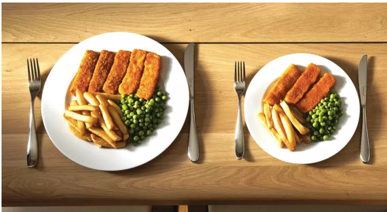
FIG. 4. EXEMPLE DE NUDGE . 17

coercion” 15 . Le nudge s’inscrit dans le registre de l’incitation. Il ne fait pas appel à la rationalité car la bonne pratique déclenchée par le nudge n’est pas forcément consciente pour l’utilisateur, en particulier dans le cas de l’usage d’une innovation numérique. Dans un article sur les nudges , Linda Cambon, chercheuse en santé publique, définit le nudge comme un « paternalisme, qui n’interdit rien et ne restreint les options de personne [...] visant à aider les individus à prendre des décisions qui améliorent leur vie » 16 . Le nudge est un corollaire de la gamification. Les deux procédés se fondent au sein de la structure de l’application pour développer une bonne pratique chez l’utilisateur. Ce dernier n’a pas forcément conscience que l’esthétique de l’application, l’emploi de badges, de récompenses, de score apparent ont une finalité « persuasive ».