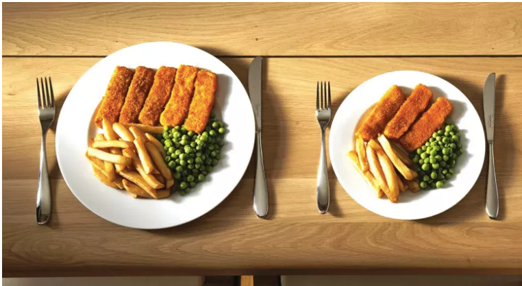
FIG. 4. EXEMPLE DE NUDGE . 17