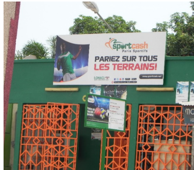
DE HAUT EN BAS, DE GAUCHE À DROITE : 1) SIÈGE SOCIAL DE LA LONASE À DAKAR. 2) SIÈGE SOCIAL DE LA LONACI À ABIDJAN. 3) KIOSQUE, POINT DE VENTE DE LA LONACI, DANS LE QUARTIER DU PLATEAU À ABIDJAN. 4) ENTRÉE D'UN CENTRE DE JEU À COCODY (PÉRIPHÉRIE NORD-EST D'ABIDJAN), « POINT DE VENTE AGRÉÉ » OÙ L'ON PEUT JOUER AU PMU, À DES PARIS SPORTIFS ET DES JEUX DE GRATTEGE. 5) ESPACE DE COURSE PLR (PENDANT LA RÉUNION, ON PEUT DONC PARIER PENDANT LA COURSE QUI SE DÉROULE GÉNÉRALEMENT EN FRANCE), À YOPOUGON DANS LA PÉRIPHÉRIE OUEST D'ABIDJAN. 6) PUBLICITÉ POUR LES JEUX D'ARGENT SUR LES MURS DES RUES D'ABIDJAN