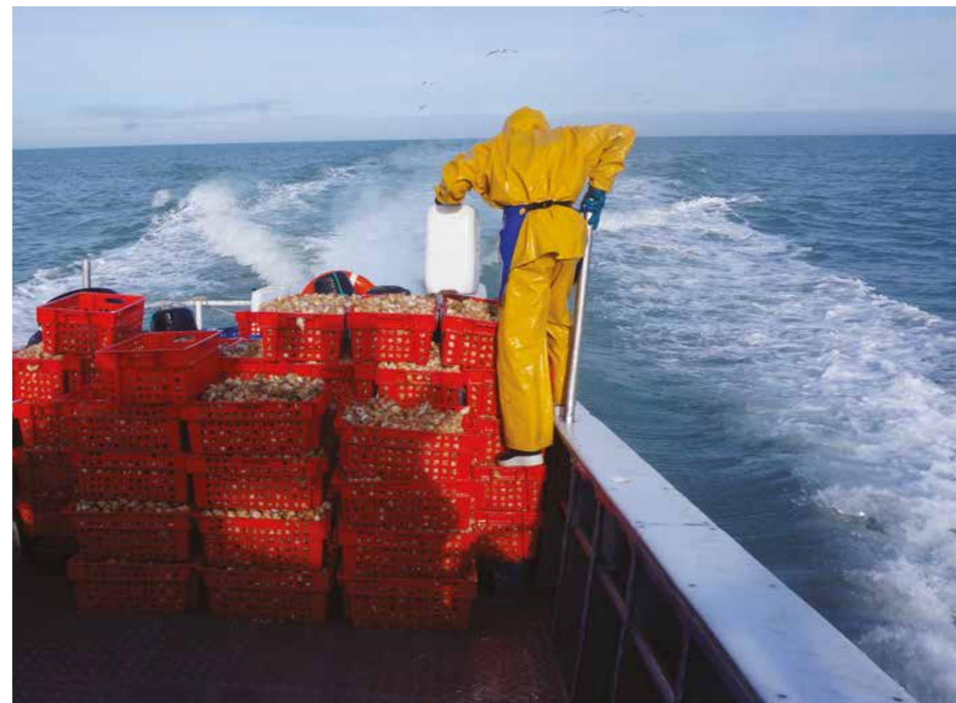
1. Embarquer avec les marins-pêcheurs de Dieppe (Martin Couetoux du Tertre)

Les étudiants ont déjà un certain désir d'arpentage lié à leurs premières recherches « en chambre », mais nous insistons sur la mise en œuvre de protocoles ciblés ; des protocoles cependant plus évocateurs que vraiment directifs. « Un dimanche à Dieppe. Se laisser surprendre » ; « un samedi après-midi à Nevers », « arpenter la grande coupe », « se laisser guider : entretiens, itinéraires, portraits, figures du lieu » ; « entrer dans les plis du territoire », « pousser les portes de... », « camper sur un site », etc. La particularité est que les étudiants enquêtent avec une acuité particulière et surtout, une intuition de transformation, qui dit quelle posture d'architecte ils se construisent. L'enquête de terrain est aiguillée