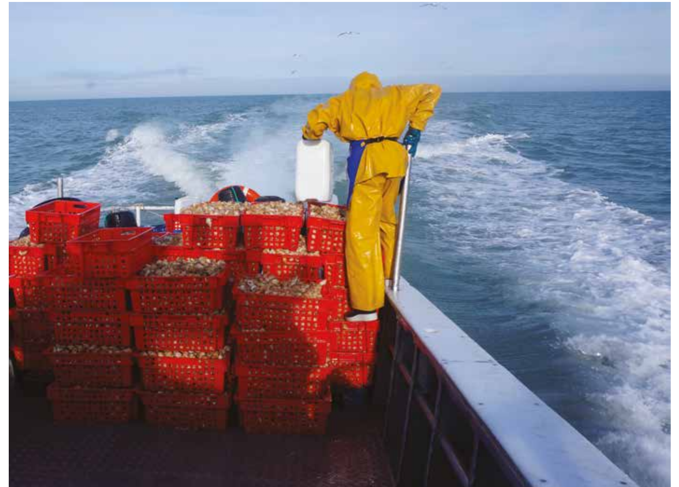
1. Embarquer avec les marins-pêcheurs de Dieppe (Martin Couetoux du Tertre)

Les étudiants ont déjà un certain désir d'arpentage lié à leurs premières recherches « en chambre », mais nous insistons sur la mise en œuvre de protocoles ciblés ; des protocoles cependant plus évocateurs que vraiment directifs. « Un dimanche à Dieppe. Se laisser surprendre » ; « un samedi après-midi à Nevers », « arpenter la grande coupe », « se laisser guider : entretiens, itinéraires, portraits, figures du lieu » ; « entrer dans les plis du territoire », « pousser les portes de... », « camper sur un site », etc. La particularité est que les étudiants enquêtent avec une acuité particulière et surtout, une intuition de transformation, qui dit quelle posture d'architecte ils se construisent. L'enquête de terrain est aiguillée