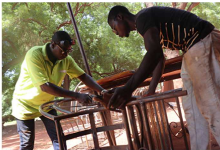
La photo 1 : face à face entre apprenti et tuteur

On y rencontre des actions, des interactions qui véhiculent des messages pleins de sens. Aussi, nous présentons quelques-unes de nos images et entreprenons de les analyser pour mettre en évidence la place combien importante de l'articulation entre le corps et les gestes dans la formation des apprentis soudeurs dans les ateliers au Burkina Faso.