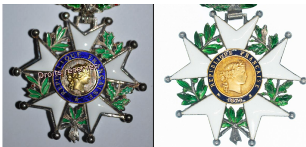
A gauche le modèle 1951, à droite le modèle 1870

Là encore, la connaissance du droit en vigueur permet de démêler l'écheveau. En effet, la dernière modification de la forme de la croix de la Légion d'honneur avant la décoration de Jean Moulin, est celle décidée par le gouvernement provisoire de la république, dans un décret du 8 novembre 1870. Elle consiste à remplacer le visage d'Henri IV par celui de la République et à inscrire autour : « République française 1870 », ainsi qu'à remplacer la couronne royale servant de bélière, par une couronne de chêne et laurier. Or la croix en question est certes conforme à ce dispositif, mais à un détail près, la date 1870 ne s'y trouve pas. L'explication vient de ce que cette croix est en fait postérieure à 1951, puisque le décret n° 51-298 du 27 février 1951 « portant modification des insignes de la Légion d'honneur et de la Médaille militaire » dispose : « Les croix et plaques de la Légion d'honneur et les Médailles militaires mises en fabrication après la publication du présent décret ne comporteront plus l'inscription '1870' ». C'est donc que la croix affichée sur le site, où l'on voit une étoile en lieu et place de 1870, est celle de Laure et non celle de Jean.