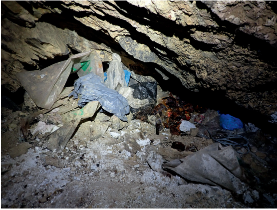
Figure 4 : Les types de déchets laissés sur place au camp au fil des explorations des années 1970.

a) Plastiques, boîtes de conserve, textiles et piles. b) Bidon pour stockage de l'eau. c) Restes de chaux durcie stockés dans des sacs plastiques ou à même le sol. d) Câble téléphonique récupérés du fond de la cavité.