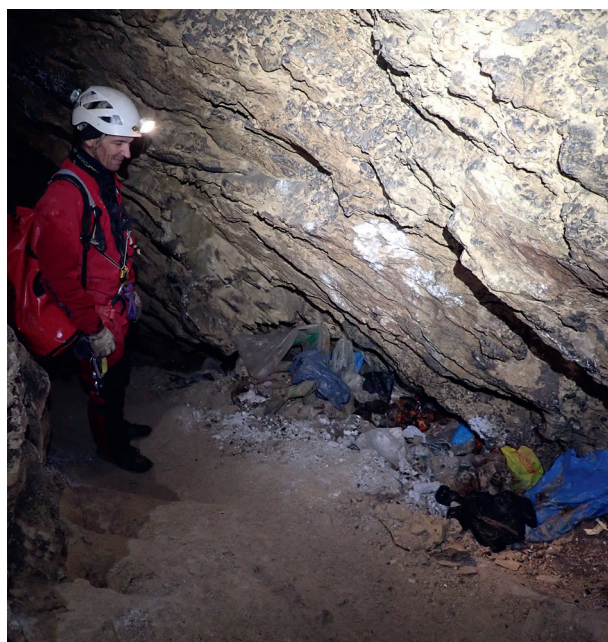
↓ Figure 10 : Acte 3 : État du camp après dépollution avec Charlotte et Olivier.