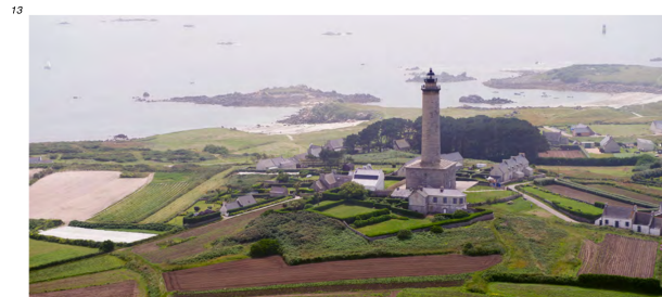
5.4.2.1.A. — Phare de l'Île de Batz, au SW (2012).

07 Vue du Nord, l'Île de Batz montre la tour du sémaphore (48° 44,78' N — 4° 00,69' W) et surtout le phare (48° 44,72' N — 4° 01,61' W), tour grise haute de 43 m, entourée de maisons. L'île est débordée de tous côtés par des dangers. Les plus au large sont : - à l'Est, la Basse Astan , couverte de 0,8 m d'eau, marquée par la bouée « Astan » (48° 44,91' N — 3° 57,66' W), cardinale Est lumineuse ; - au Nord, la Grande Basse (48° 45,92' N — 4° 01,64' W), couverte de 0,5 m d'eau ; - à l'Ouest, Men Aodi (48° 44,64' N — 4° 03,39' W), roche non balisée découvrant de 0,1 m.