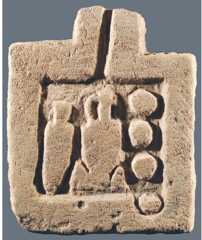
Fig. 3. Table d'offrande de Karanog, JE 40170.