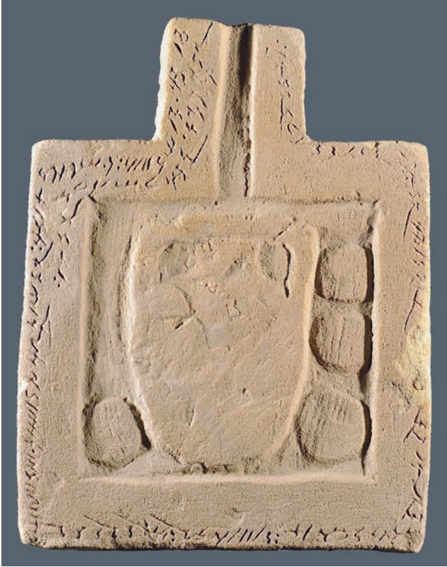
Fig. 2. Table d'offrande de Karanog, JE 40174.