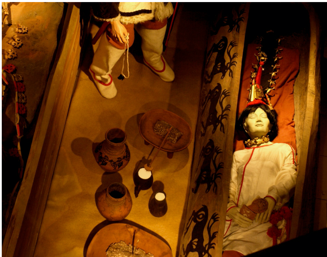
Reconstitution de la sépulture de la Princesse Musée national Anokhine de la République d'Altai (Gorno-Altaiïsk)

échoué. Aujourd'hui l' Ak Jang continue donc d'exister sous une forme éclatée en plusieurs organisations et réseaux informels, en désaccord les uns avec les autres sur de nombreuses