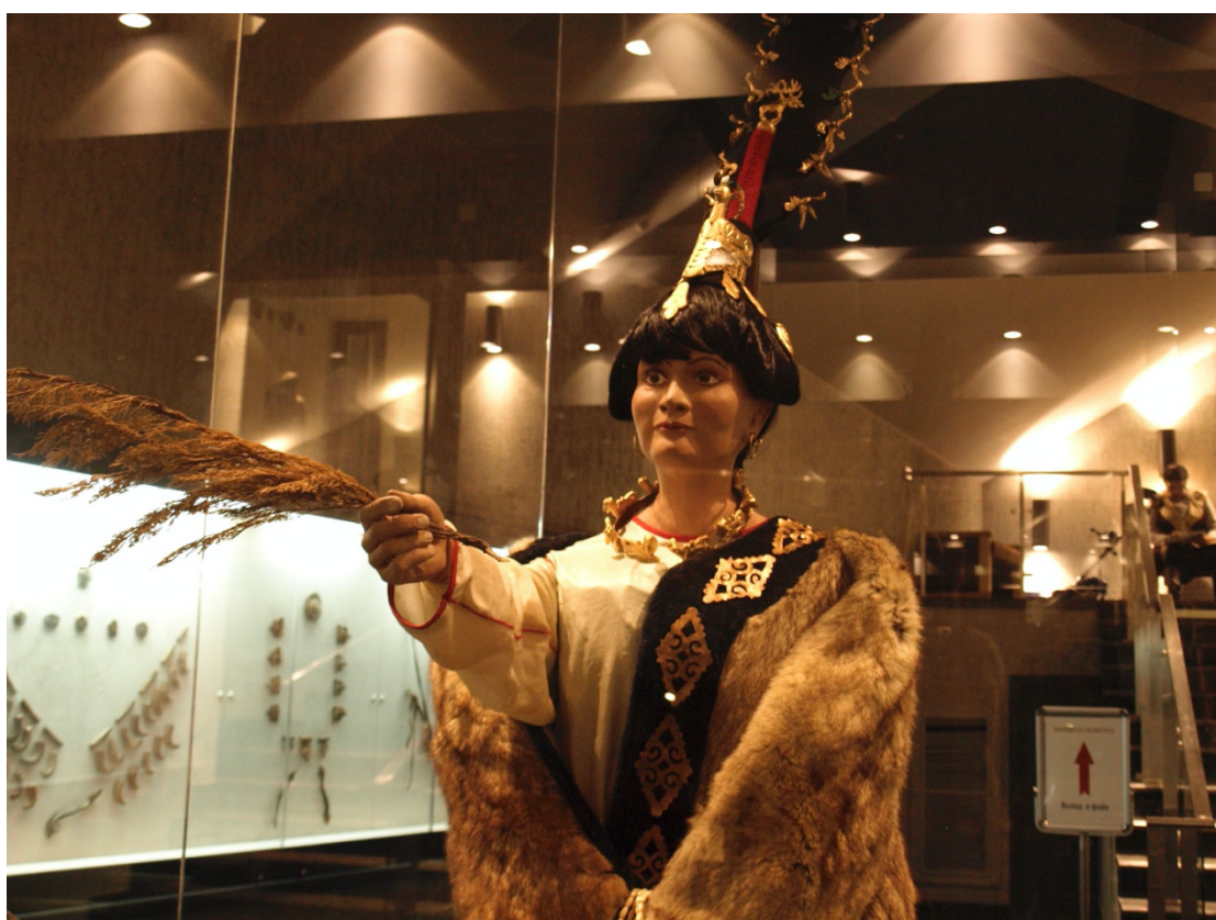
Jeune femme aisée scythe Musée national Anokhine de la République d'Altaï (Gorno-Altaiïsk)

Depuis son retour à Gorno-Altaiïsk en 2012 et jusqu'à 2015, la momie était physiquement présente dans l'exposition, mais restait invisible aux visiteurs dans son