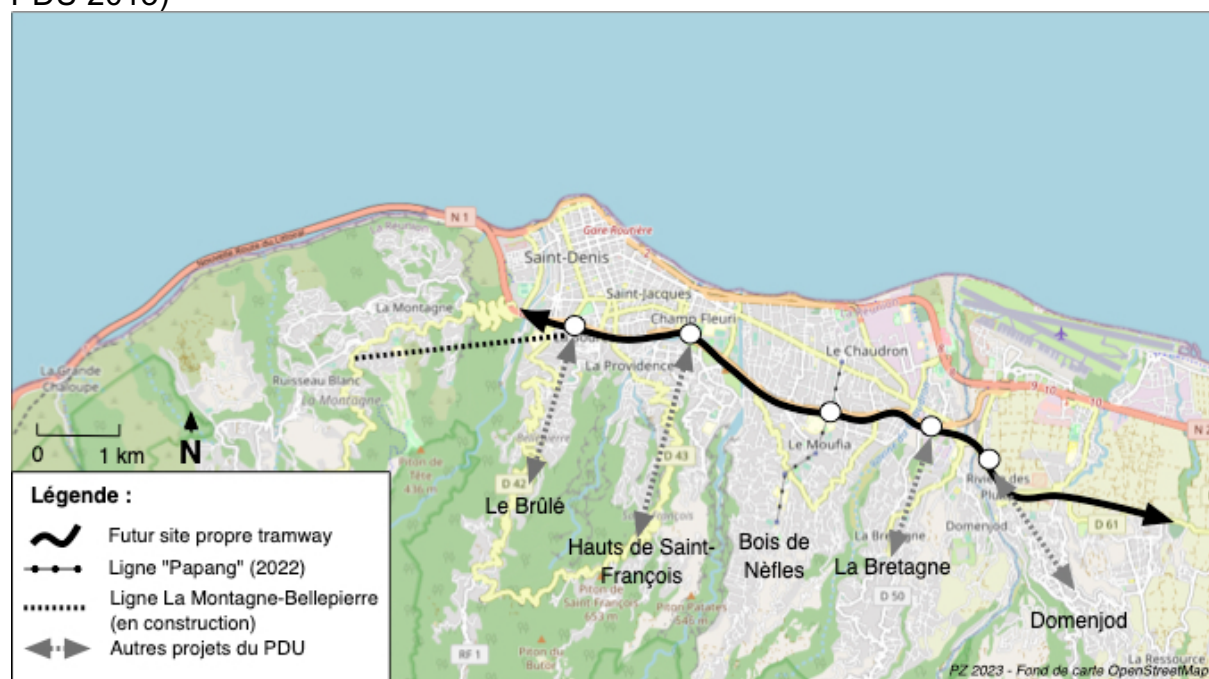
Figure 9 - Le projet de développement global des liaisons téléportées entre les hauts de l'agglomération de Saint-Denis de la Réunion et la bande côtière

Ces deux lignes font partie d'un projet de développement (Plan de déplacements Urbains de 2013) qui en comportait cinq au total, ce qui rapprocherait Saint-Denis de la Réunion de la configuration développée à Medellin (figure 9). On peut considérer que l'agglomération de Saint-Denis de la Réunion a pris de vitesse de nombreux autres projets apparus auparavant, et a su réduire les délais de réalisation. Il ne s'est passé que 5 ans entre la décision de mise en œuvre (et donc le démarrage de la concertation) et la première mise en service.