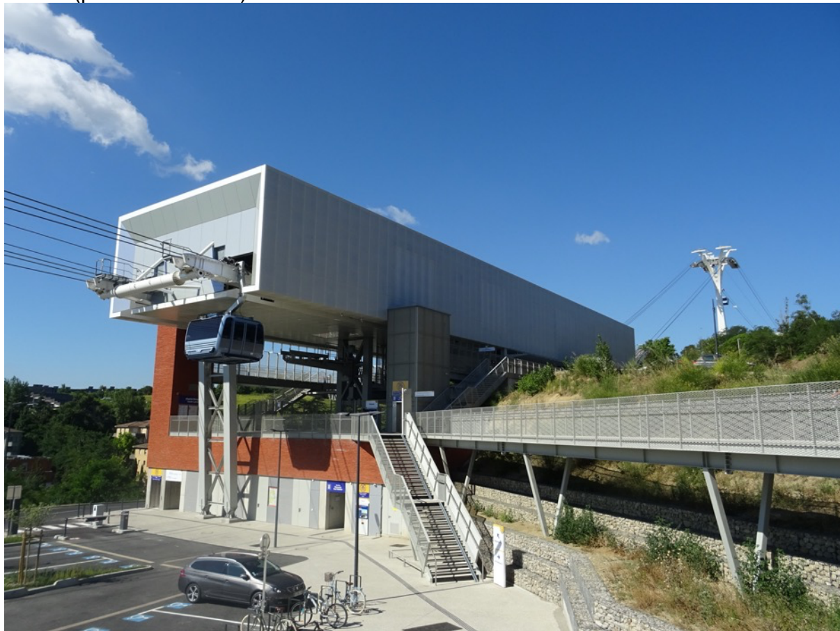
Figure 12 - La station intermédiaire Hôpital de Rangueil sur la ligne du Telemousain : une émergence visible mais relativisée par son implantation sur un plan incliné

peuvent être très visibles des alentours de la ligne et constituer des atteintes à un paysage urbain. L'intégration des stations intermédiaires devient donc un enjeu majeur, notamment les plus vastes d'entre elles qui servent à changer de direction (les équipements nécessaires pour changer de boucle de câble sont assez volumineux).