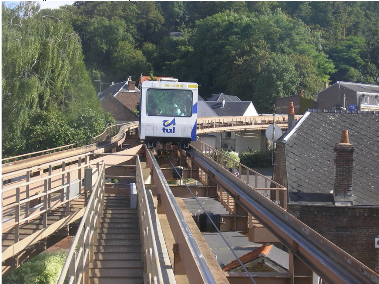
Figure 6 - Cabine du Poma 2000 de Laon vue au niveau de la station intermédiaire de Vaux

L'exemple le plus abouti est celui du Miniméto construit par le constructeur italien Leitner. Mis en service en 2008 à Pérouse (Italie), il dessert une ligne de 4 km, destinée à relier la ville haute de Pérouse à la gare et à un parc de stationnement gratuit destiné aux visiteurs (le trafic automobile est strictement limité dans le centre historique), avec une dénivelée de l'ordre de 160 mètres. Cette ligne comporte 7 stations et elle est exploitée avec 27 voitures dotées d'un roulement sur pneus, permettant d'acheminer 3000 passagers par heure. Une seconde réalisation à Pise a été inaugurée en 2017. La ligne relie l'aéroport Galileo Galilei à la gare centrale, soit une longueur de 2 km avec une station intermédiaire. Sa capacité est plus restreinte avec 1132 passagers par heure (données constructeur).