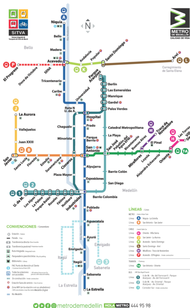
Figure 4 - La place des téléportés dans le plan schématique du réseau de Medellin

C'est la conception d'un réseau complémentaire de grande ampleur (par rapport aux réalisations précédentes) au sein de l'agglomération de Medellin (Colombie) qui change la donne, avec une large publicité internationale et un certain engouement du personnel politique et (dans une moindre mesure) des techniciens des collectivités pour un mode jusque-là loin d'être considéré comme légitimement urbain... Cet ensemble de réalisations étalées depuis 2004 donne également des références aux constructeurs, qui peuvent faire valoir la pertinence de cette solution technique, et sa reproductibilité dans des contextes comparables.