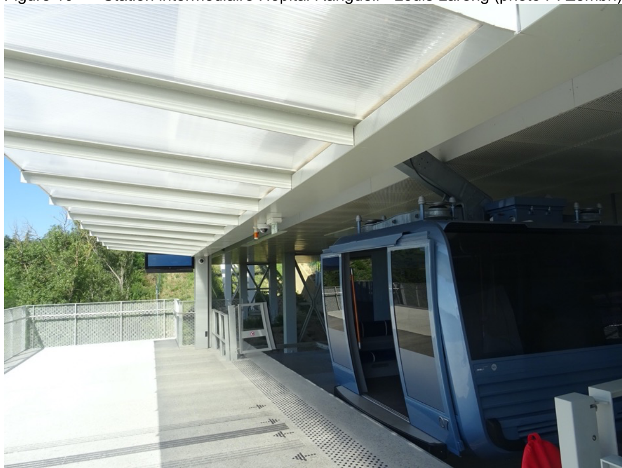
Figure 10 - Station intermédiaire Hôpital Rangueil - Louis Lareng

La ligne comporte deux stations d'extrémité et une station intermédiaire au niveau de l'hôpital de Rangueil. Les cabines la traversent à vitesse réduite. Cinq pylônes ont été nécessaires sur le tracé.