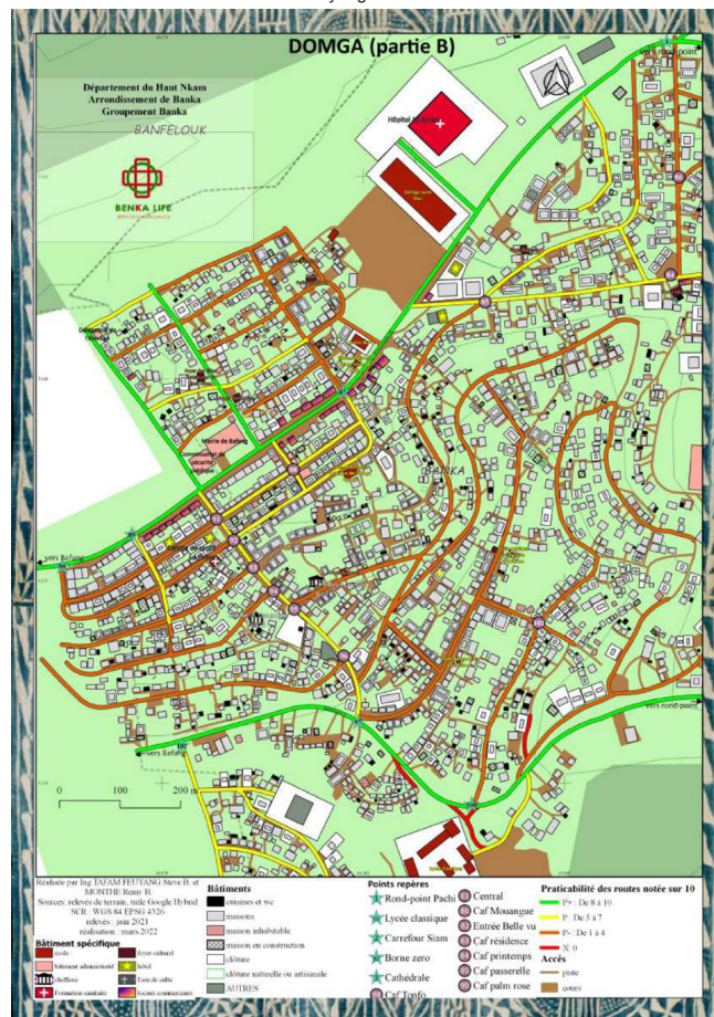
Figure 3. Carte synthétisant la démarche menée par l'association Benka Life

Mettre en place à grande échelle une forme mieux adaptée de cartographie et d'adressage réclamait de s'appuyer sur les moyens locaux, sur les pratiques réelles et la lecture du territoire par les populations, tout en mobilisant les applications de localisation désormais largement diffusées grâce à la téléphonie mobile. Allier ainsi les savoirs territoriaux aux technologies disponibles pour tous a permis de mettre en place un plan d'adressage construit avec l'ensemble des parties prenantes : dispensaires de santé, décideurs publics, habitants... Le propos est tout autant de proposer une solution adaptée et immédiatement mobilisable par l'ensemble des parties présentes car coconstruite à chaque étape du processus, que d'expérimenter une méthode pouvant être reproduite sur d'autres territoires. Même si elle peut paraître limitée dans la précision de son dispositif, elle a en effet pour atout la vitesse de sa réalisation (quelques semaines) et la sobriété des moyens techniques et humains à mobiliser.