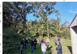
Figure 2. Visuels résumant la démarche mise en œuvre dans le cadre du plan de paysage à Saint-Vran

Devant l'émergence d'une « société de la connaissance », nous tentons ici d'illustrer les conditions de mise en œuvre d'une société « apprenante » (Nylan, 2002) pour des territoires qui doivent s'adapter à des mutations rapides et à une forte mise en concurrence. Ces dynamiques laissent en effet, a priori , peu de temps pour construire et s'approprier des savoirs territorialisés. Le temps de l'expérimentation permet d'identifier les conditions et les moyens de mobilisation pour une montée en compétences des parties prenantes. Nous relatons ici une mobilisation d'acteurs locaux, en situation de précarité, qui traduit des mécanismes collectifs et pédagogiques.