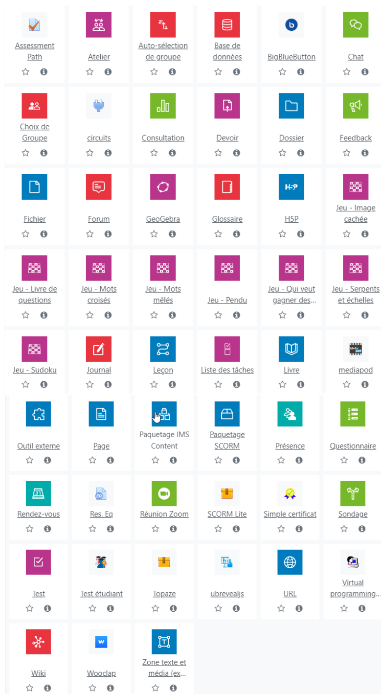
Ensemble des outils disponibles sur le Moodle de l'Université de Bordeaux.

Nous avons regroupé les outils selon leur fonction principale. Nous avons précisé combien d'outils par type, sur l'ensemble des cours, ont été mis en place. Comme nous le voyons, la majorité est dédiée au contenu des cours, y compris en téléchargement ou lien externe. Le nombre d'outils dédiés à la dimension sociale est à nuancer, car un outil "annonces" (qui permet la diffusion d'un message à l'ensemble des étudiants inscrits au cours) existe sur chaque cours (dès la création) et n'est pas toujours utilisé par les enseignants (qui préfèrent parfois utiliser l'email). Les espaces de dépôt de devoirs sont utilisés de façon plutôt régulière, offrant à la fois un moyen pour l'enseignant de centraliser les devoirs sans surcharger sa boîte e-mail et,