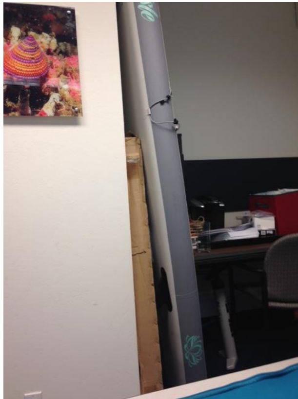
Figure 4: So California ! La planche de Stand Up Paddle d'une collègue entreposée dans le bureau (elle y est restée longtemps car l'été fut particulièrement froid)