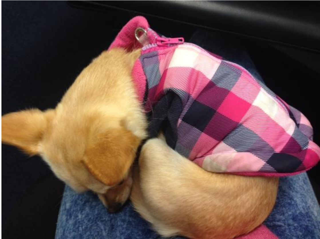
Figure 2: La « puppy therapy », Buttercup dormant sur mes genoux pendant que j'essaye de travailler sans la déranger (sic)