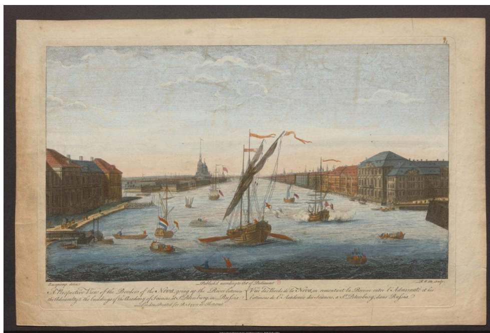
Vue des bords de la Neva , gravée par R. Watts et éditée par Robert Sayer à Londres, exemplaire colorié conservé à la Bibliothèque de l'Institut national d'Histoire de l'Art, VO Rus SP4.