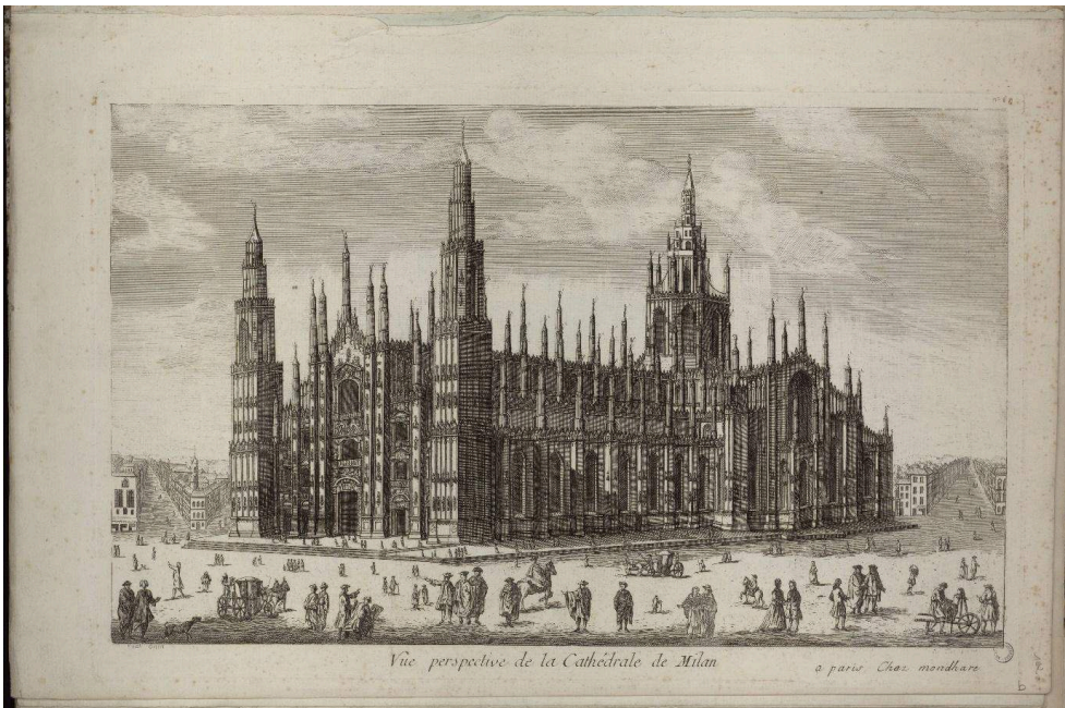
Vue perspective de la Cathédrale de Milan , éditée par Mondhare. Vue d'optique non coloriée provenant de la collection Jehannin de Chamblanc. BM Dijon, Recueil EST 103.