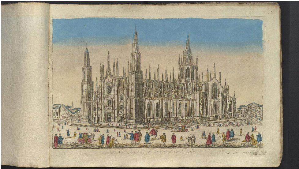
Vue perspective de la Cathédrale de Milan , éditée par Mondhare. Vue d'optique coloriée de provenance inconnue, BM de Dijon, recueil EST 3128.