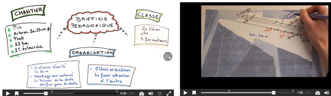
Figure 2 : Copie écran de la vidéo interactive mettant en évidence les descripteurs de la situation mobilisés et les décisions prises par les encadrants pour l'organisation du chantier en sécurité

L'organisation des modalités pédagogiques du chantier forestier relatée par les trois enseignants interrogés s'est déroulée au cours de plusieurs situations parcellisées dans le temps, formelles et informelles entre d'une part les encadrants du chantier forestier pédagogique et d'autre part entre le pilote pédagogique du chantier et le donneur d'ordre. Pour élaborer la ressource de formation mettant en évidence les éléments de la figure 1, il ne nous était pas possible de filmer une trace d'activité courte typique de la situation étudiée. Nous avons choisi de retenir un des entretiens d'instruction au sosie regroupant l'ensemble des éléments de la figure 1 pour construire une animation filmée reproduisant la trace écrite que pourrait construire l'équipe encadrante du chantier lors d'une réunion portant sur l'organisation pédagogique du chantier. Dans cette animation, la voix off correspond au discours de l'enseignant faisant le récit de l'organisation des modalités pédagogiques du chantier (montage audio réalisé à partir d'extraits de l'entretien d'instruction au sosie). Ce discours met en évidence les indicateurs et variables mobilisés par l'équipe pédagogique. L'animation matérialise ces informations pour favoriser leur identification (figure 2). Ainsi, le professionnel décrit ce qu'il fait pendant qu'apparaissent sur la vidéo progressivement, sous forme écrite, les différents éléments structurant l'activité (figure 2).