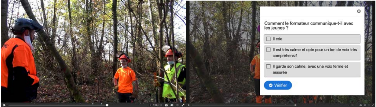
Figure 3 : Copie écran de la vidéo interactive de la situation jouée en forêt (situation 2)

Outre les questionnements qui interrompent la vidéo, des incrustations apparaissent, pour mettre en exergue la succession des actions dialogiques du formateur (voir figure 4) et permettre leur lecture alors qu'elles ne s'entendent plus du fait de l'avancée de la vidéo et de sa bande sonore.