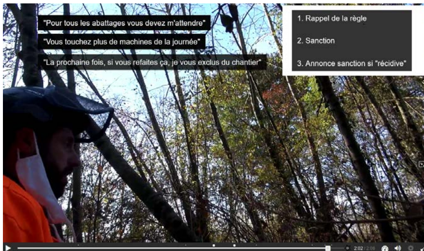
Figure 4 : Copie écran de la vidéo interactive, avec incrustation des propos de l'enseignant en lien avec les concepts mis en scène (situation 2)

Outre les questionnements qui interrompent la vidéo, des incrustations apparaissent, pour mettre en exergue la succession des actions dialogiques du formateur (voir figure 4) et permettre leur lecture alors qu'elles ne s'entendent plus du fait de l'avancée de la vidéo et de sa bande sonore.