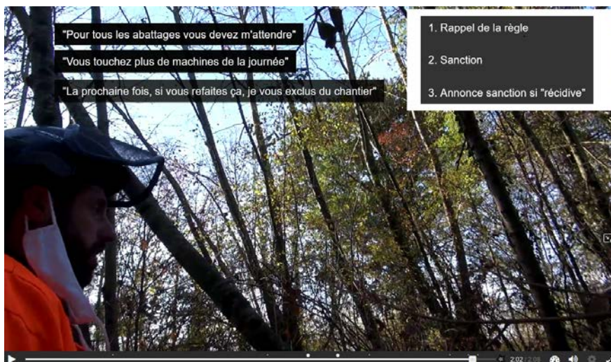
Figure 4 : Copie écran de la vidéo interactive, avec incrustation des propos de l'enseignant en lien avec les concepts mis en scène (situation 2)

Outre les questionnements qui interrompent la vidéo, des incrustations apparaissent, pour mettre en exergue la succession des actions dialogiques du formateur (voir figure 4) et permettre leur lecture alors qu'elles ne s'entendent plus du fait de l'avancée de la vidéo et de sa bande sonore.