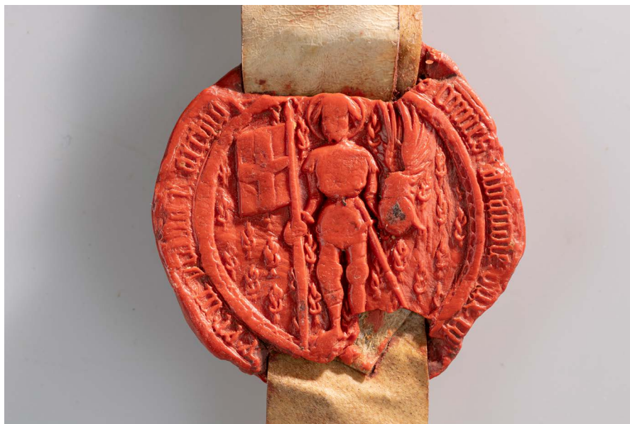
Figure 2. Sceau armorié d'Amédée VIII, représenté en pied sous les traits de saint Maurice, tenant une bannière aux armes de Savoie, avec le badge au nœud de Savoie dans le champ du sceau. Traité d'alliance avec le duc de Bourgogne, 1404

Dijon, Archives départementales de la Côte-d'Or, n° inv. B 11928