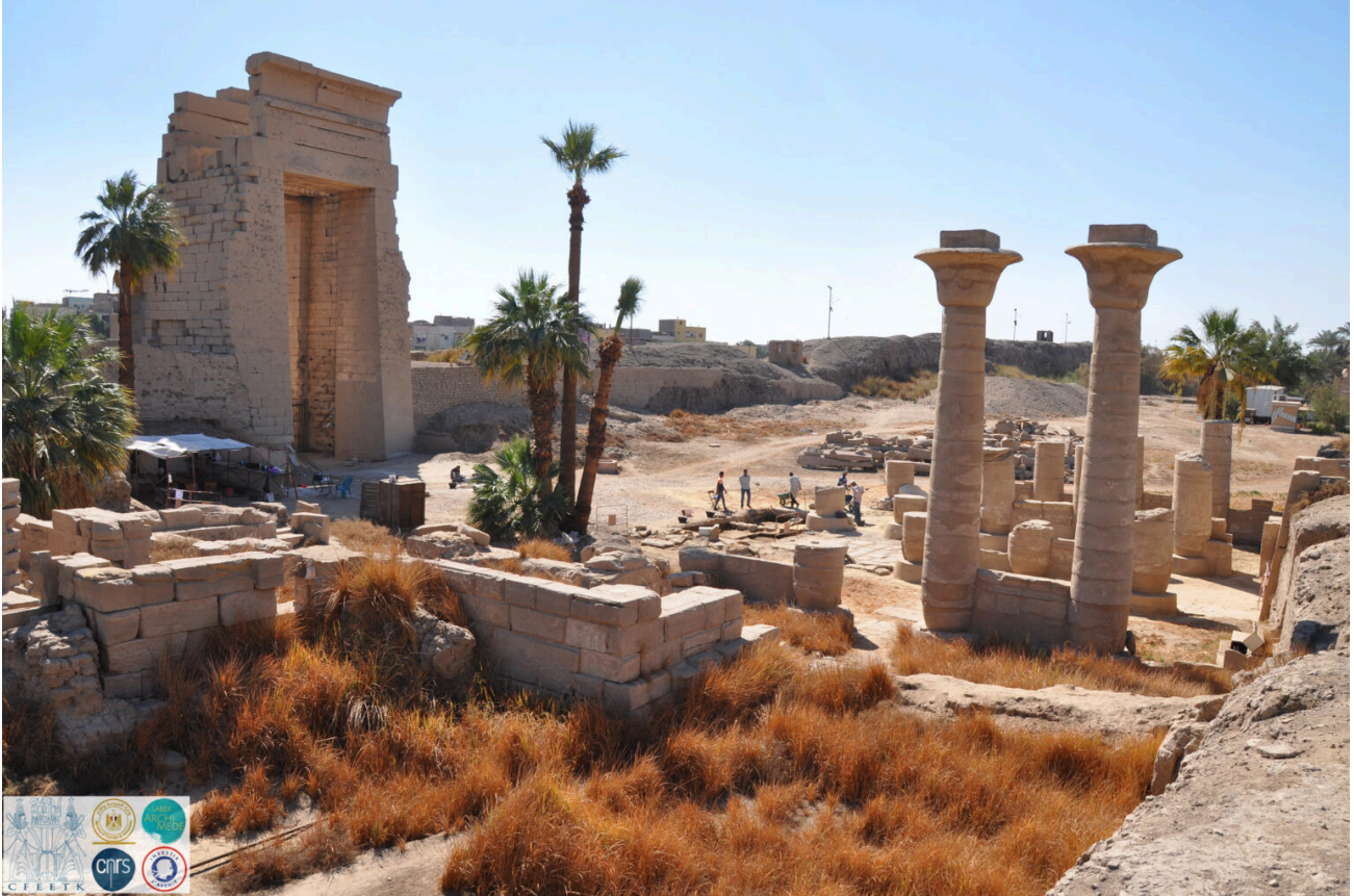
Le parvis du temple oriental de Karnak et la colonnade de Taharqa.

Entre février et mars 2022, s'est déroulée la première campagne de fouilles de la colonnade orientale de Taharqa à Karnak (Opération 196 du CFEETK – OP196). Cette opération, qui s'inscrit dans le cadre du projet d'étude des colonnades kouchites à Karnak, bénéficie du soutien du CFEETK (MoTA/UAR 3172 du CNRS) ainsi que du LabEx ARCHIMEDE 1 . Cet édifice du principal pharaon de la 25 e dynastie fut construit contre le pylône du temple oriental de Ramsès II, c'est-à-dire sur le parvis de ce sanctuaire fermé à l'est par la grande enceinte et la porte monumentale de Nectanébo I er . Cette colonnade dite « propylée », formée par quatre rangées de cinq colonnes, est l'exemple le mieux conservé de ce type de construction caractéristique de la période kouchite. Les autres furent érigées à l'avant du temple de Khonsou à Karnak (presque entièrement détruite), devant le temple de Karnak-Nord (démantelée à l'époque ptolémaïque) et devant le temple de Mout à Karnak-Sud (fortement remanié sous les Ptolémées). La colonnade orientale constitue ainsi un cas d'étude intéressant dans un secteur archéologique qui est resté jusqu'à présent peu exploré. En outre, les