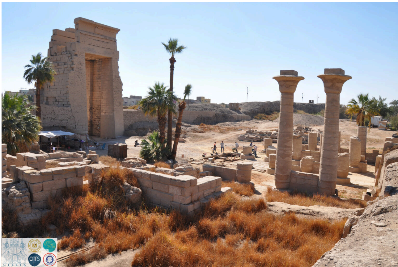
Le parvis du temple oriental de Karnak et la colonnade de Taharqa.

Entre février et mars 2022, s'est déroulée la première campagne de fouilles de la colonnade orientale de Taharqa à Karnak (Opération 196 du CFEETK – OP196). Cette opération, qui s'inscrit dans le cadre du projet d'étude des colonnades kouchites à Karnak, bénéficie du soutien du CFEETK (MoTA/UAR 3172 du CNRS) ainsi que du LabEx ARCHIMEDE 1 . Cet édifice du principal pharaon de la 25 e dynastie fut construit contre le pylône du temple oriental de Ramsès II, c'est-à-dire sur le parvis de ce sanctuaire fermé à l'est par la grande enceinte et la porte monumentale de Nectanébo I er . Cette colonnade dite « propylée », formée par quatre rangées de cinq colonnes, est l'exemple le mieux conservé de ce type de construction caractéristique de la période kouchite. Les autres furent érigées à l'avant du temple de Khonsou à Karnak (presque entièrement détruite), devant le temple de Karnak-Nord (démantelée à l'époque ptolémaïque) et devant le temple de Mout à Karnak-Sud (fortement remanié sous les Ptolémées). La colonnade orientale constitue ainsi un cas d'étude intéressant dans un secteur archéologique qui est resté jusqu'à présent peu exploré. En outre, les