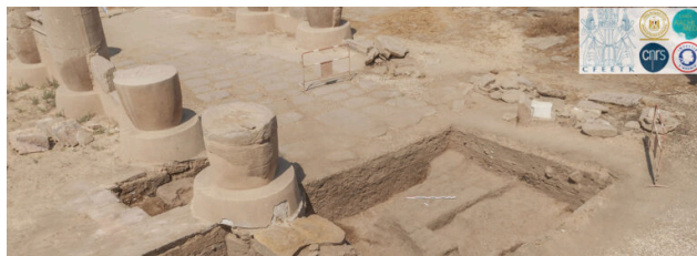
Zone fouillée en fin de mission.

Le second volet de la mission concernait la documentation des blocs épars provenant de la colonnade et conservés à proximité. Il s'agit essentiellement de fragments des