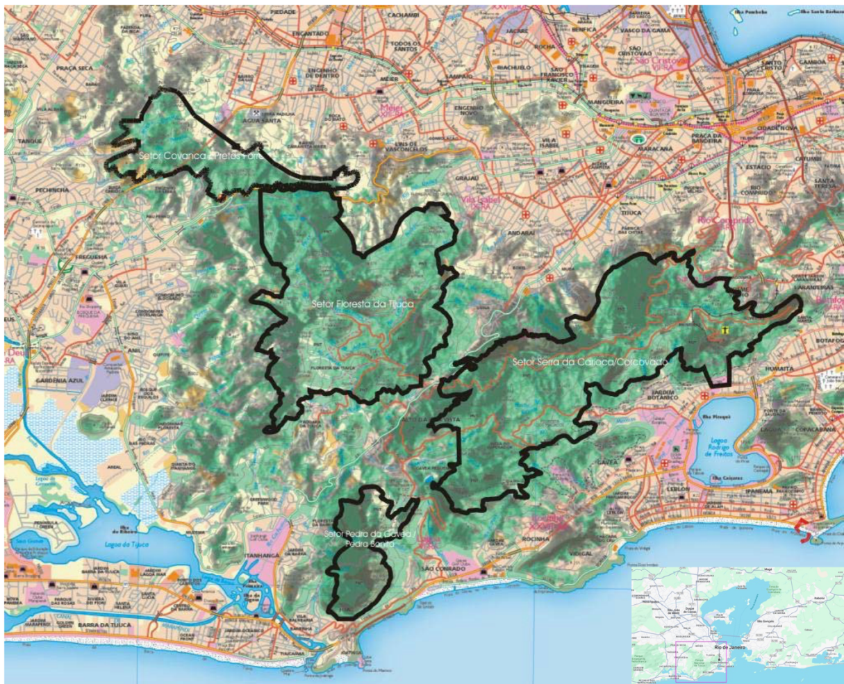
Figure 1. Parc national de Tijuca.

Nous avons alors construit un premier scénario autour d'un parc fictif 7 , un ensemble de rôles d'acteurs sociaux 8 , plus le ou la gestionnaire du parc, qui est l'ultime décisionnaire (voir le cycle pédagogique à la Figure 2), autour du processus de zonage des sous-parties du parc 9 . Dans ce scénario de jeu, selon son profil et les éléments d'intérêt prioritaires (attrait culturel, attrait touristique, lieu de nidification d'une espèce menacée...), chaque joueur ou joueuse jouant le rôle d'un acteur social (membre du conseil de gestion) va tenter d'influencer la décision du conseil sur le niveau (type) de conservation pour les sous parties du parc qu'il ou elle considère prioritaires. Des conflits d'intérêts émergent ainsi rapidement entre les joueurs et joueuses, conduisant à diverses stratégies de négociation (par exemple, formation d'une coalition, échange de soutien mutuel pour des objectifs respectifs, etc.).