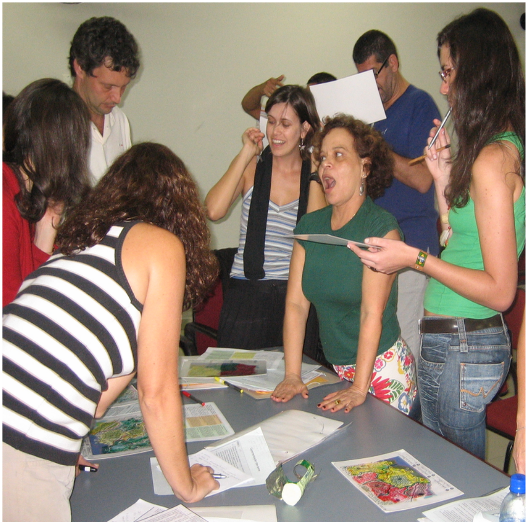
Figure 4. Exemple de négociation en cours.