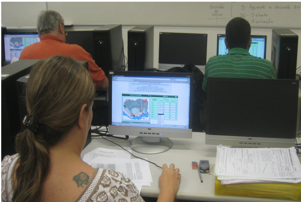
Figure 5. Session de jeu informatisée.