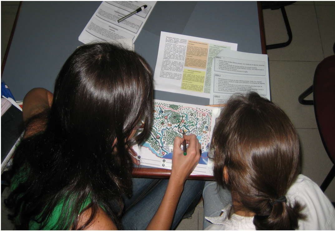
Figure 3. Cartes et documentation.