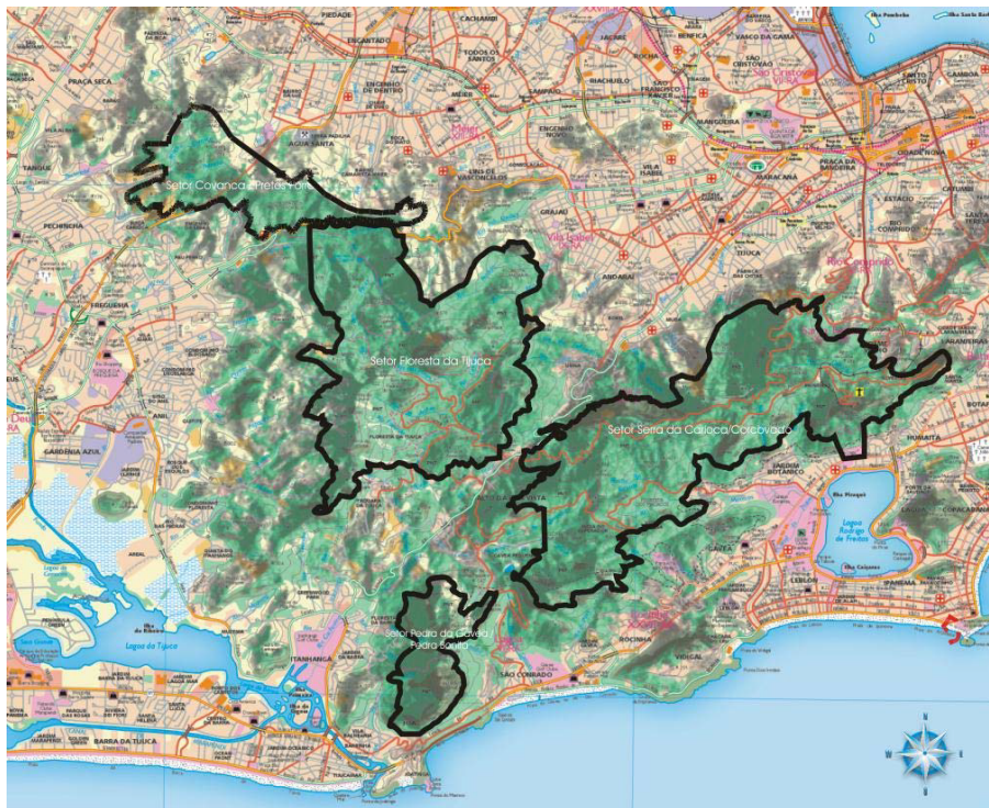
Figure 1. Parc national de Tijuca.

Nous avons alors construit un premier scénario autour d'un parc fictif 7 , un ensemble de rôles d'acteurs sociaux 8 , plus le ou la gestionnaire du parc, qui est l'ultime décisionnaire (voir le cycle pédagogique à la Figure 2), autour du processus de zonage des sous-parties du parc 9 . Dans ce scénario de jeu, selon son profil et les éléments d'intérêt prioritaires (attrait culturel, attrait touristique, lieu de nidification d'une espèce menacée...), chaque joueur ou joueuse jouant le rôle d'un acteur social (membre du conseil de gestion) va tenter d'influencer la décision du conseil sur le niveau (type) de conservation pour les sous parties du parc qu'il ou elle considère prioritaires. Des conflits d'intérêts émergent ainsi rapidement entre les joueurs et joueuses, conduisant à diverses stratégies de négociation (par exemple, formation d'une coalition, échange de soutien mutuel pour des objectifs respectifs, etc.).