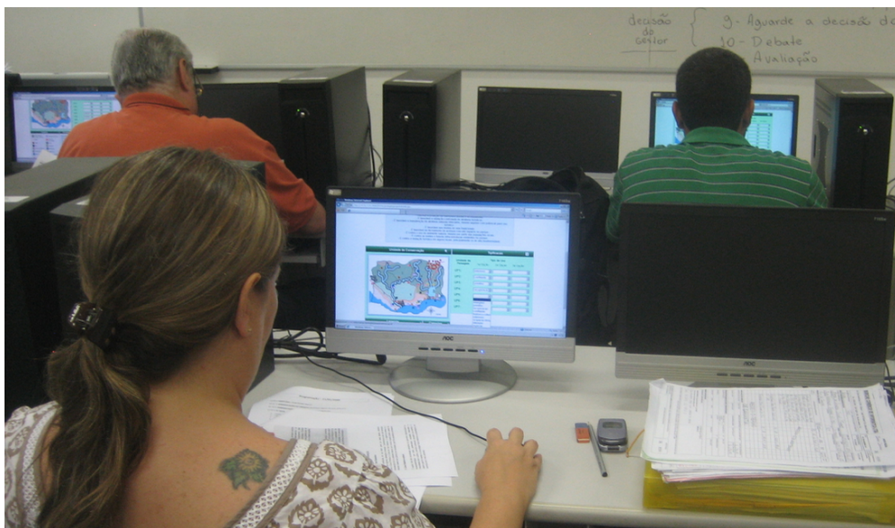
Figure 6. Session de jeu informatisée