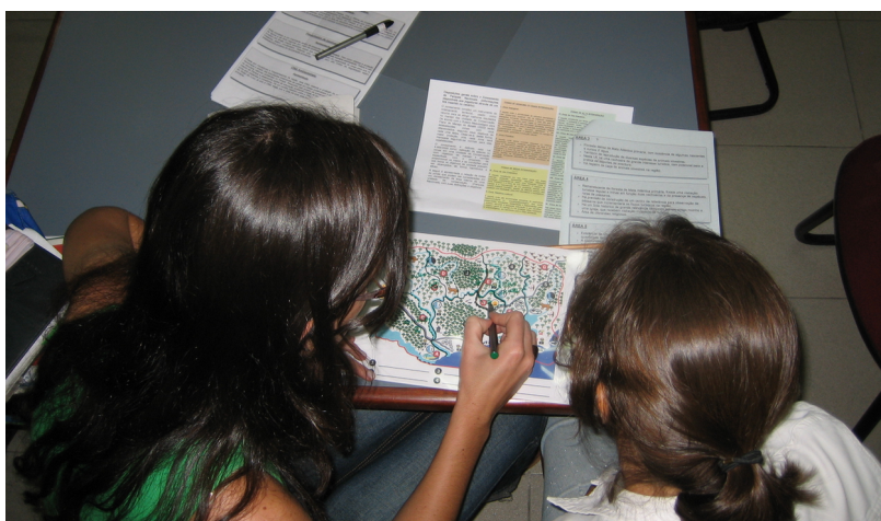
Figure 3. Cartes et documentation