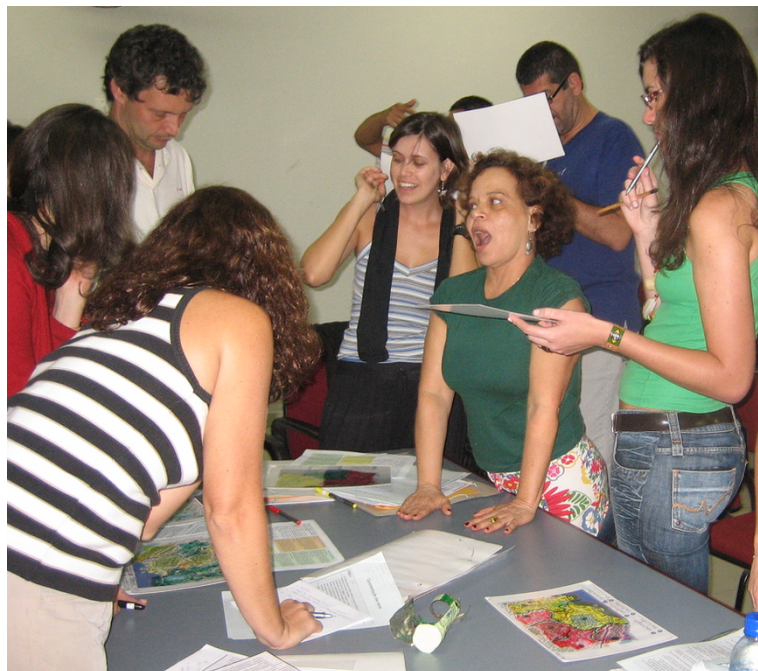
Figure 4. Exemple de négociation en cours