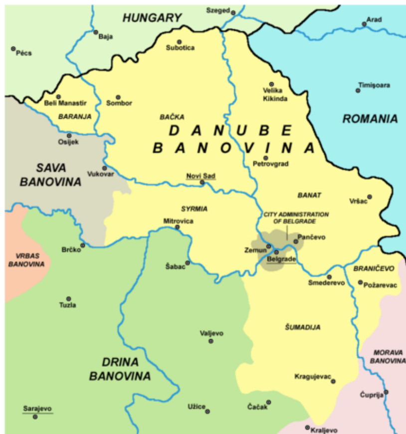
Political situation in 1931: