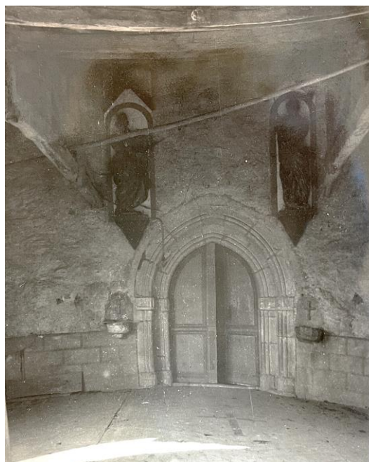
Fig. Aspect de la voûte et du porche de l'église vers 1951. AD09, 28W413.

En 1949 101 , le conseil municipal adresse une demande de subvention en Préfecture pour mener des réparations à l'église. Ces dernières concernent la voûte de l'église qui est fissurée et sa toiture 102 . Le chantier est suivi par monsieur Baque, architecte à Saint-Girons. Le coût estimé total atteint d'abord 153 690 francs, mais par suite de remarques sur le projet de la part de la commission des édifices culturels 103 , le devis estimatif de l'architecte en 1951 fait plus que doubler