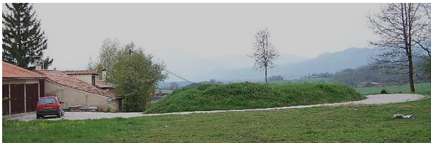
Fig. Emplacement possible du château médiéval de Montgauch. Cr. Nathalie Dupuy.

La famille aristocratique d'Aspet est un des principaux lignages fidèles des comtes de Comminges à compter du XIIe siècle, et fort certainement auparavant, et dispose de droits conséquents sur la partie ouest du Couserans, montagne et prépyrénaïques. Les Aspet sont coseigneurs de Montgauch en 1317 20 . Les lacunes documentaires en Couserans ne permettent pas de remonter plus anciennement, mais rien n'interdit de proposer que cette sujétion aux Aspet soit bien plus ancienne. Le château de Montgauch est alors tenu en paréage par Roger Aspet et