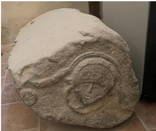
Fig. Couverture d'auge posé sur le sol dans l'église.

Pourquoi, ces peintures ont-elles été recouvertes d'enduit de chaux et quand ? On peut proposer que l'enduit ait été posé parce que les décors peints se dégradent. Un enduit en chaux blanche des murs intérieurs de l'église est mentionné en 1781 45 . Les visites pastorales de la seconde moitié du XVIIIe siècle n'indiquent pas de recouvrement à réaliser sur les murs de l'église. L'enduit est donc antérieur à la première visite conservée (1753), peut-être pas de beaucoup, car il est en bon état en 1781. Après 1781 et avant son décroûtage lors de la découverte des décors peints, cet enduit a été repeint (dans un style XIXe siècle 46 ) (photo ci-dessous).