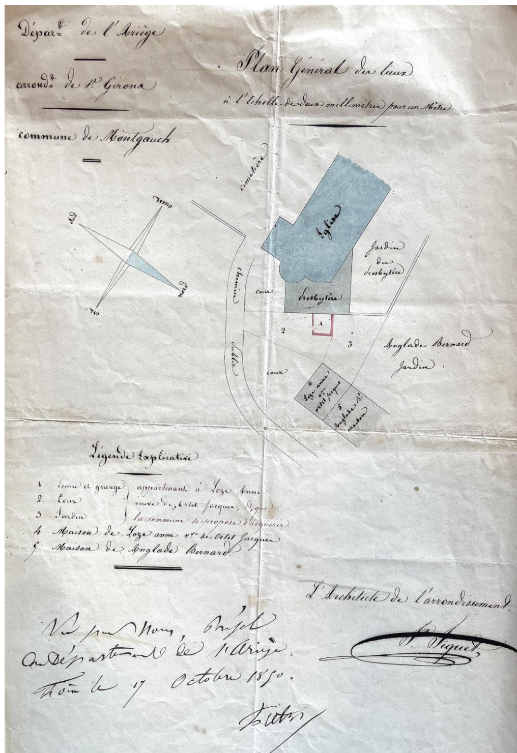
Fig. AD09, 4V19. Plan de l'église et du presbytère en 1850. Parcelles (1, 2 et 3) achetées par la commune pour l'agrandissement.

En 1840, le conseil municipal mentionne avoir prévu une réparation d'urgence au cimetière ( l'état déplorable de notre cimetière ) qui a été abandonnée faute de fonds, puis prévoit d'en réparer finalement la clôture 87 . En 1841, il est à nouveau sujet des réparations au porche et au clocher (celles prévues en 1838 n'ont pas été réalisées) 88 . Le compte-rendu indique des dangers de chute , les bâtiments sont en très mauvais état. Il est mené une nouvelle imposition