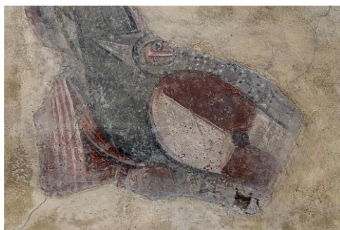
Fig. Miles du décor peint à Montgauch.

Les décors peints 40 situés dans l'église ont été réétudiés récemment par Nathalie Piano (2010a et 2010b). Cette dernière propose que ceux-ci soient une réponse contre l'hérésie de la part de l'évêché de Couserans, évêché très impliqué au début du XIIIe siècle dans la lutte anti-hérétique 41 . Elle propose donc que les peintures murales les plus anciennes datent de la fin du XIIe siècle ou plutôt du début du XIIIe siècle 42 , tandis que Marcel Durliat analyse qu'elles datent des travaux de modernisation de l'abside, qu'il propose seconde moitié XIIe siècle ; l'église initiale, partie basse en petits moellons, étant possiblement datée du XIe siècle 43 . L'inventaire général des monuments et des richesses artistiques à propos des peintures monumentales en Ariège précise la datation des décors anciens dans le milieu du XIIe siècle 44 . Les bandes lombardes du chevet et la morphologie de ces baies évoquent le XIIe siècle (deuxième Art roman). Une enquête dans les collections archéologiques et iconographiques régionales à propos des vêtements du miles qui est peint (casque conique sans nasal, grand bouclier allongé) pourrait aider à la datation. On peut citer pour exemple, le décor peint de l'église de Saint-Martin-des-Puits (11) qui comprend un