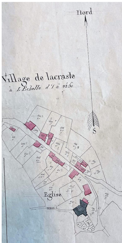
Fig. Cadastre napoléonien (1829) AD09 3P731

Le cadastre ou terrier du XVIIe siècle indique un toponyme Sainte-Anne, proche de la limite avec Montégut qui correspond forcément à un ancien oratoire, chapelle ou église 9 .