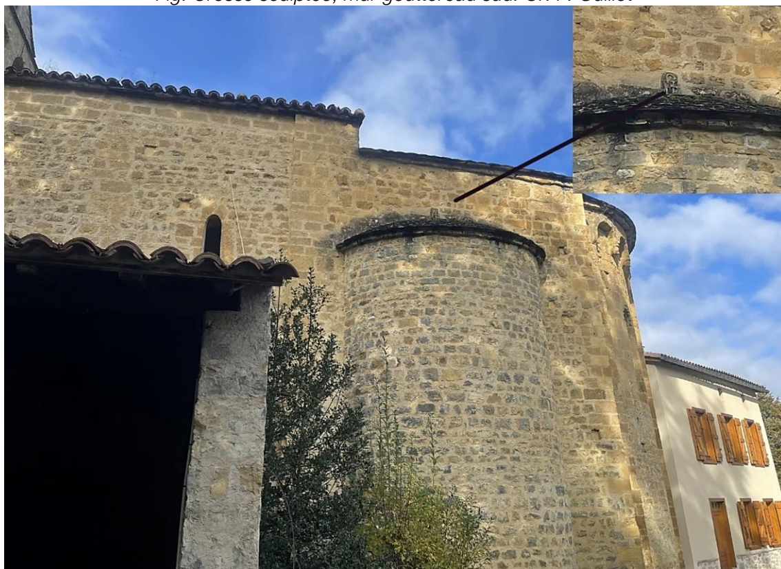
Fig. Crosse sculptée, mur gouttereau sud.

On peut confirmer que l'église a bien été au moins en partie construite par l'évêché, car une pierre sculptée — insérée en hauteur dans le parement externe du mur gouttereau sud — est décorée de la crosse épiscopale. L'église reste épiscopale jusqu'à la Révolution française. En 1686, la reconnaissance indique « le pré de monseigneur l'évêque de Couserans à Bareille ». Un marguillier 37 « de l'église paroissiale de Monseigneur de Saint-Pierre » est un contributeur du cadastre-terrier du XVIIe siècle et les marguilliers de la même église le sont pour la taille de 1773 38 ,