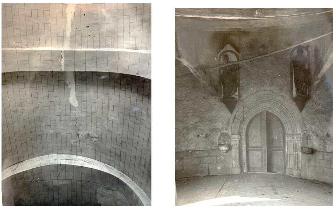
Fig. Aspect de la voûte et du porche de l'église vers 1951. AD09, 28W413.

En 1927 98 , la mairie passe un traité de gré à gré avec un artisan pour la réparation du clocher de l'église (crépissage en ciment, construction d'un balcon en ciment armé et encadrement de 3 cloches) et les comptes communaux attestent que les travaux ont été effectués. En 1941, la commune adresse une demande de subvention au Préfet pour la réfection de la toiture (15 301 francs) 99 . Elle reçoit une aide de 2000 francs et les travaux sont exécutés en 1942 100 .