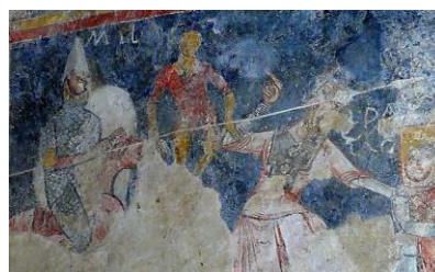
Fig. Saint-Martin-des-Puits (11). Cr. R. Tréton

personnage dont le casque est similaire et dont les peintures sont datées du début du XIIe siècle. La forme du bouclier du miles évoque aussi une période strictement antérieure à la fin du XIIe siècle. En l'état des indices de datation, le cœur du XIIe siècle paraît donc le plus probable pour les décors peints les plus anciens. Pour répondre à cette question de datation, il serait surtout essentiel de réaliser un phasage des élévations bâties de l'église, du type archéologie du bâti avec stratigraphie, permettant de préciser les bâtis sur lesquels reposent les peintures, donc d'obtenir une chronologie relative du bâtiment. En effet, le bâti de cette église représente la documentation