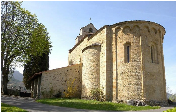
Fig. Église de Montgauch.

1 Montgauch est une commune située au nord des Pyrénées couserannaises (Ariège) et au sud de la vallée du Salat, à quelques kilomètres à l'ouest de Saint-Girons et de Saint-Lizier. Elle est composée, au nord, de terrains vallonnés calcaires et marneux d'altitudes moyennes (entre 400 m et 500 m) et, au sud, d'une tranche du versant nord du massif forestier et karstique de l'Estélas jusqu'à plus de 1000 m d'altitude.