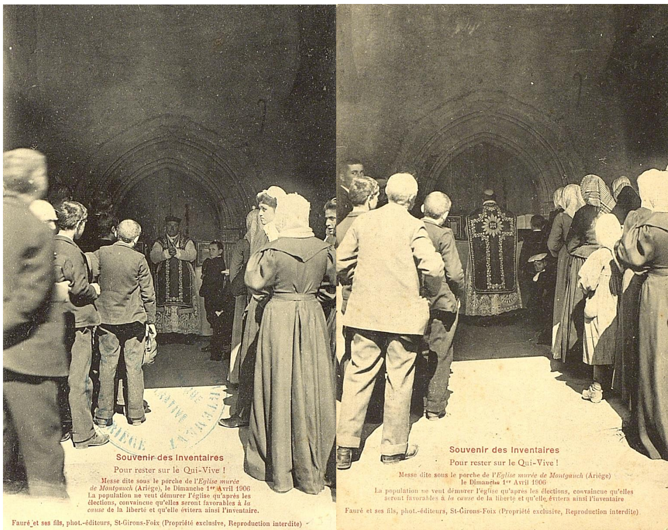
Fig. AD09 2F1689 et 690. (Notez la séparation des femmes et des hommes)

l'attitude du desservant et par son courrier. Le Ministre de l'Instruction publique, des Beaux-Arts et des Cultes demande à l'évêque la destitution du prêtre et supprime son salaire (septembre 1895) 78 . Un an après, le curé de Prat tente une médiation et l'abbé Canal s'excuse auprès du Préfet et se rétracte. On lui redonne son salaire, sans aucun rappel.