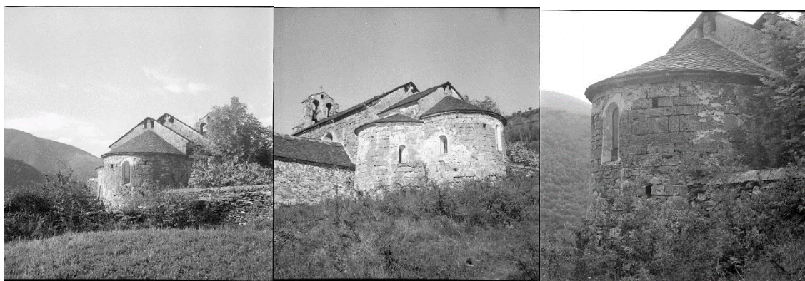
Fig. Exemples d'images conservées au MAP. 1953 et 1963. Remarquez les boulines maçonnées de l'échafaudage des murs et les sculptures sur les faîtes, juste sous la toiture actuelle.