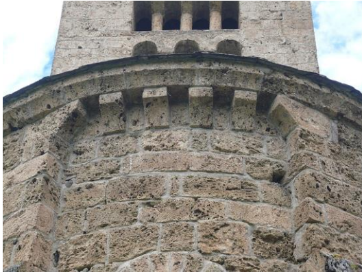
Fig. Église d'Axiat.

l'abbaye de Saint-Volusien de Foix et Vernaux ne dépend jamais des chanoines de Foix. Malgré l'absence de mention documentaire, elle pourrait bien finalement avoir dépendu de l'abbaye de Lagrasse, parce que le patrimoine de cette abbaye en haute Ariège n'est connu que par des documents falsifiés qui peuvent comprendre des erreurs et