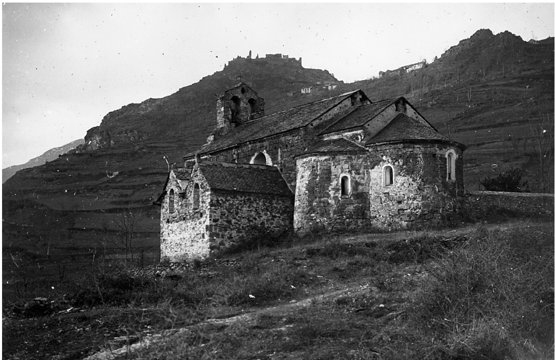
Fig. Photographie 1905. Copie AD31, 53 FI 260.

L'église de Vernaux est construite sur un replat en flanc et en rive droite de la haute vallée de l'Ariège, le long d'un accès entre Luzenac — village en fond de vallée doté d'un pont médiéval — et Lordat et son grand castrum comtal. En bordure aval du Planet de la Gleyzo 1 où elle est érigée, cette église est bien visible de loin et ce choix de situation participe clairement à sa mise en scène. L'église est isolée du village construit 400 m plus haut, dans la pente du versant. Cet isolement — tout comme la situation de l'église en position basse par rapport à l'habitat paysan — est conforme à ce que nous connaissons du peuplement par villages casaliers ou villages « à maisons » en