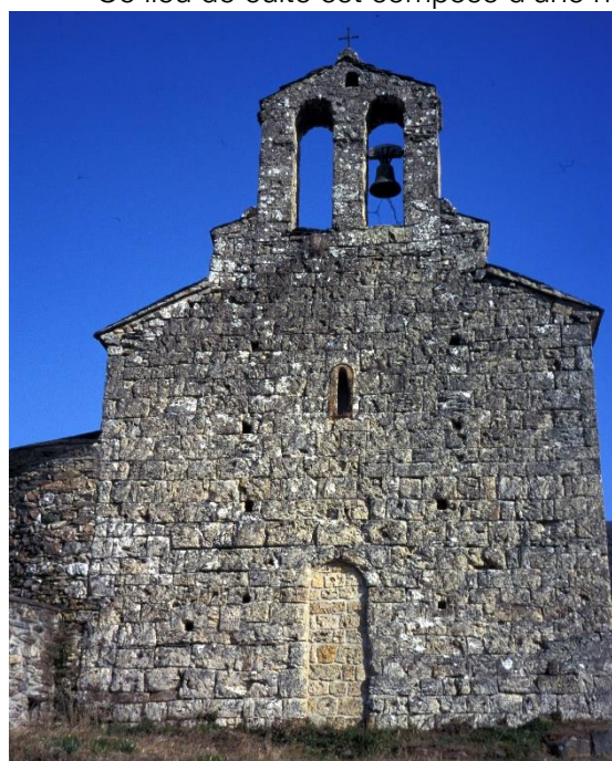
Fig. Notez les boulines façonnés.

Ce lieu de culte est composé d'une nef — voûtée d'un berceau — se terminant sur un chevet à plan tréflé 10 dont le niveau de toiture et de voûte est plus bas que celui de la nef, tandis que le chœur est aussi plus étroit que la nef. Entre les absidioles et l'abside, la disposition des baies n'est pas symétrique (ajout ?). Et les baies des absidioles et de l'abside sont de factures différentes de celle du mur fronton... 11