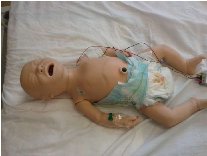
[Fig.1 : Exemple de mannequin nourrisson « haute-fidélité ». On remarque les fils et capteurs qui permettent de relier le mannequin à l'ordinateur et à l'opérateur qui commande ses réactions.]

Les séances commencent par une familiarisation avec l'environnement et le matériel qui servira à la mise en situation. Le contexte, le décor et les objets varient selon les formations puisqu'ils dépendent du type de prise en charge travaillé. Si, pour un entretien en psychiatrie, une table et une chaise suffisent, il faut recréer un bloc opératoire pour simuler une opération chirurgicale. Les outils à disposition, eux-aussi, changent selon les spécialités et le niveau de technicité requis par l'exercice, ce qui a notamment une incidence sur le type de « patient » proposé en simulation. Le rôle du « patient simulé » peut en effet être joué par un apprenant, un acteur professionnel ou un élève d'école de théâtre. Mais les patients peuvent aussi être simulés par des mannequins qui seront nommés « basse-fidélité » ou « haute-fidélité » en fonction de leur potentiel d'interactivité.