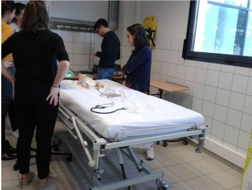
[Fig.3 : Les apprenants prennent connaissance du mannequin nourrisson haute-fidélité et du matériel à leur disposition avant la mise en situation.]

Les informations de départ livrées par le formateur indiquent que les internes devront jouer leur propre rôle en imaginant qu'ils travaillent dans un service d'urgences pédiatriques comportant plusieurs secteurs. Le scénario concerne un nourrisson de trois mois qui a vomi cinq fois au cours des dernières heures et qui ne se trouve pas dans leur secteur. Les internes comprennent qu'ils vont être appelés parce que l'état de l'enfant se dégrade subitement, bien qu'ils ne connaissent ni l'enfant ni les personnes qui l'accompagnent. Ils ont cependant accès aux constantes du bébé grâce au système informatique du tableau des entrées qui est mutualisé entre les secteurs et peuvent savoir que l'examen clinique d'entrée était normal.