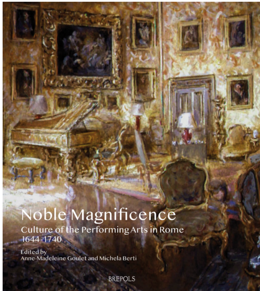
Couverture du second ouvrage de l'équipe PerformArt, sous presse.

Depuis mars 2023, notre base de données est en accès libre sur Huma-Num et met à disposition de la communauté scientifique et du grand public l'ensemble de nos découvertes (plus de 6 000 transcriptions de documents d'archives, et quelque 2 500 événements-spectacles répertoriés et décrits). Elle s'accompagne d'un thésaurus de près de 2 300 entrées.