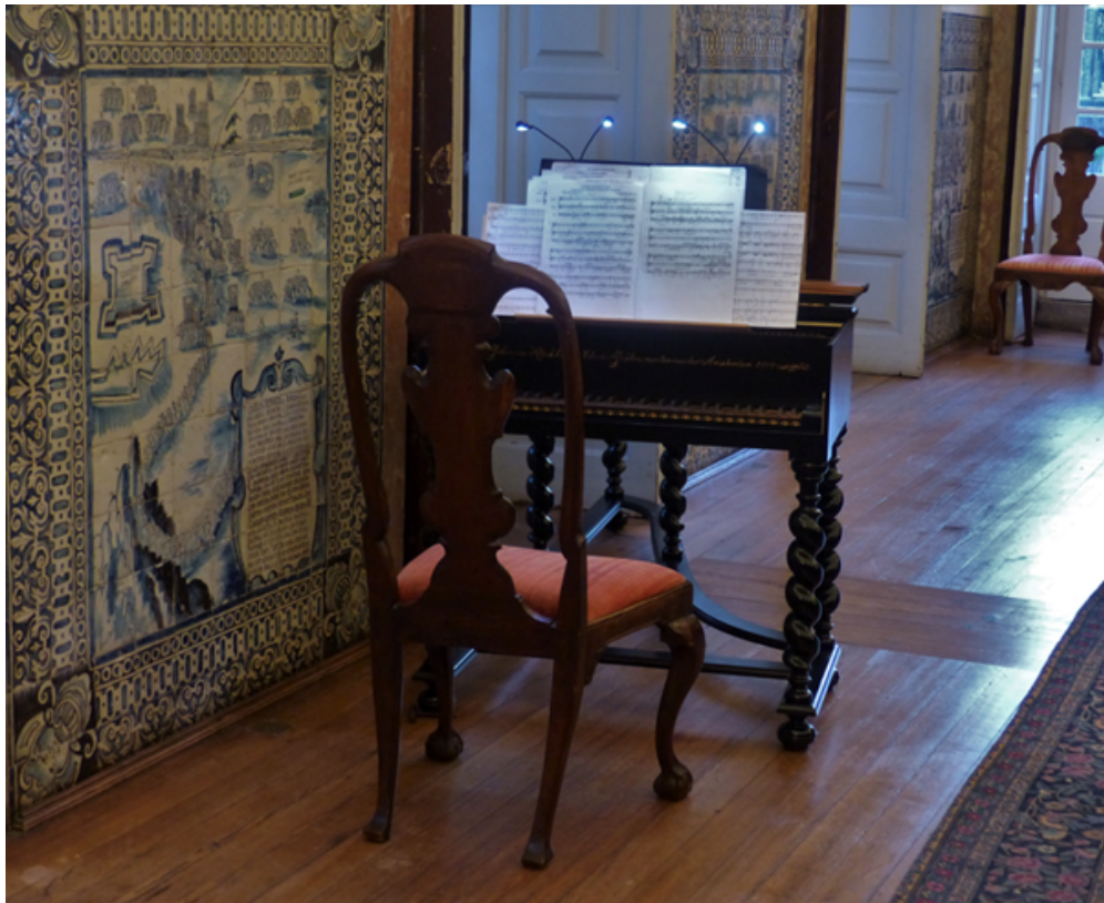
15 octobre 2019 : dispositif du concert au Palácio Fronteira.