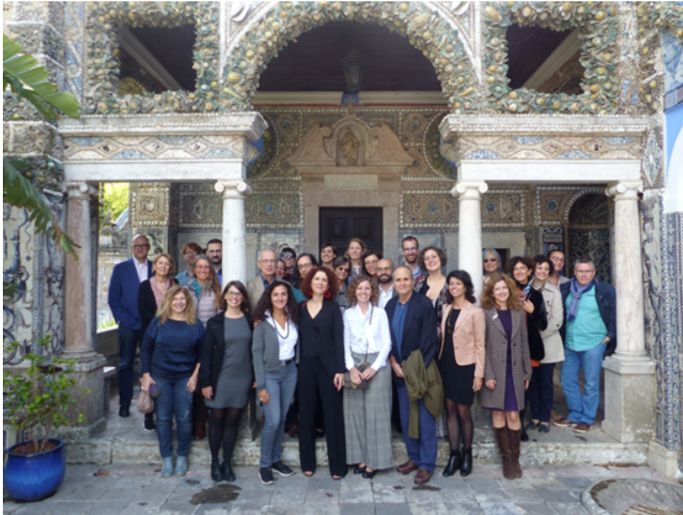
Équipe PerformArt, Palácio Fronteira, Lisbonne, novembre 2019.