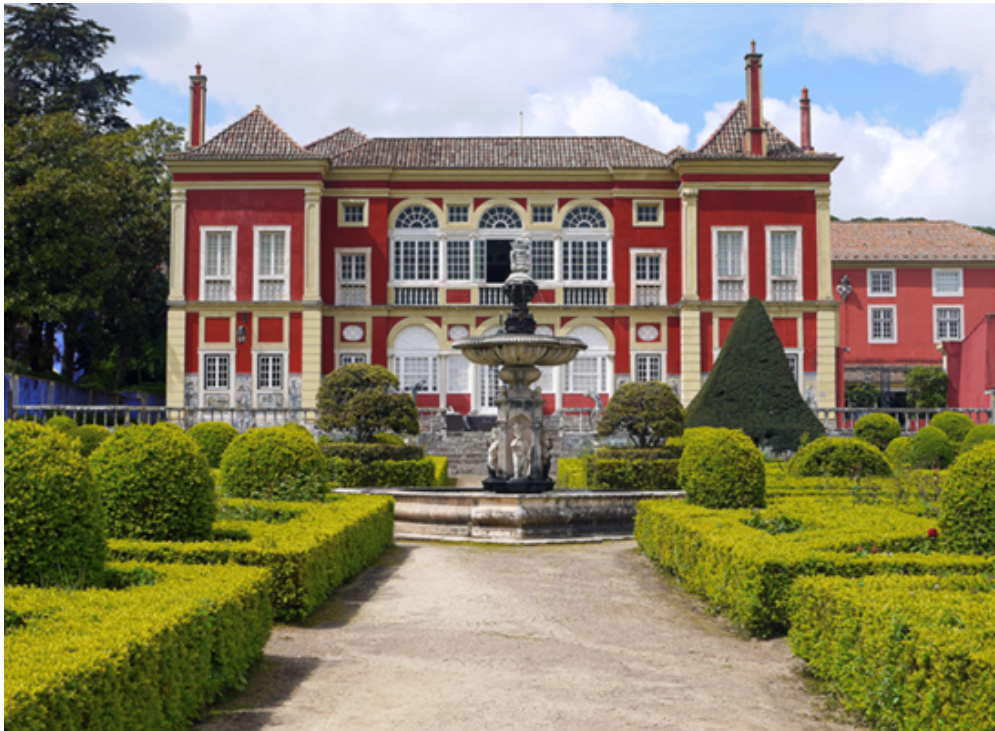
Palácio Fronteira, construit en 1671-1672, Lisbonne.

En octobre 2019, une journée de notre colloque final s'est déroulée au palais des marquis de Fronteira, à Lisbonne (voir photo ci-dessous).