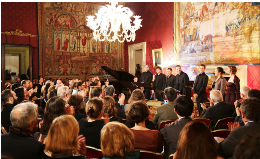
5 décembre 2016 : concert de Faenza au Palais Farnèse.

L'enquête de grande envergure qui a été menée dans les archives et les bibliothèques romaines a permis de retrouver des œuvres, notamment des partitions de musique, susceptibles d'intéresser des artistes aujourd'hui. Le projet a pu s'articuler ainsi avec des pratiques contemporaines de la création, dans le domaine musical mais aussi dans celui de la danse et de la peinture. Il s'est ouvert avec un concert au palais Farnèse, le 5 décembre 2016, donné par l'ensemble Faenza .