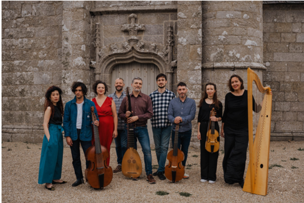
Août 2022 : ensemble Faenza, enregistrement du CD Bernabei, église Notre-Dame de Trédrez-Locquémeau.