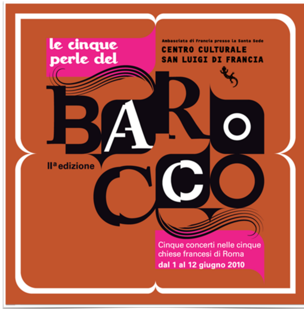
Programme du festival Le cinque perle del Barocco, Centre culturel Saint-Louis-des-Français, juin 2010.

Le projet MUSICI a donné lieu à une seconde expérience artistique. Le colloque final du projet, qui eut lieu à l'Institut historique allemand de Rome en janvier 2012, s'est en effet achevé avec un concert au palais Farnèse, donné par l'ensemble Faenza , qui avait réuni six interprètes autour de la musique de Bellerofonte Castaldi, un musicien originaire de Modène, luthiste, chanteur, poète et aventurier, qui s'était retrouvé à Rome suite à une série d'aventures rocambolesques, et qui a laissé une autobiographie pour l'instant restée manuscrite, laquelle constitue un document unique pour un musicien de l'époque. Le concert reposait sur une co-production entre l'EFR, l'Institut historique allemand de Rome et l'Ambassade de France à Rome.