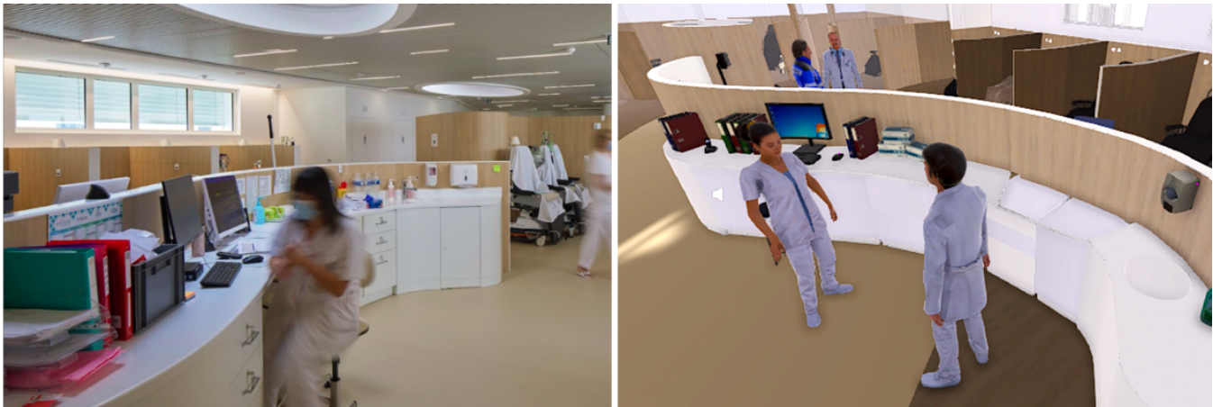
FIGURE 2 : Le parcours ambulatoire étudié dans le projet OPEVA. À gauche, le parcours ambulatoire réel. À droite, la simulation virtuelle du même parcours.