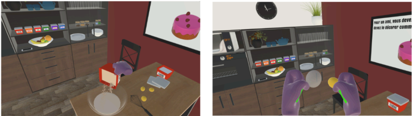
FIGURE 4 : La cuisine virtuelle de l'environnement HOMERIC. À gauche, un utilisateur ajoute de la farine pour réaliser le gâteau. À droite, l'utilisateur interagit avec un œuf.

la tête et des mains). Ensuite, nous avons proposé à chacun un entretien d'explicitation mené par un psychologue diplômé et formé à l'EdE, centré sur l'épisode de la casserole bleue. Les entretiens ont par la suite été transcrits. Le comité d'éthique de déontologie et d'intégrité scientifique de la recherche de Nantes Université a validé le protocole expérimental et tous les participants ont signé un formulaire de consentement éclairé.