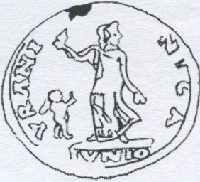
3. Contorniate d'Uran(i)us (dessin de l'auteur)