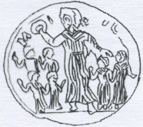
4. Contorniate de Milicus (dessin de l'auteur)