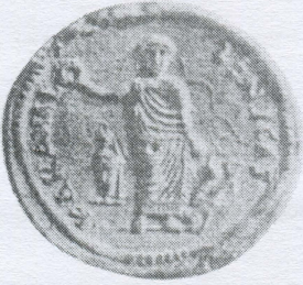
1. Contorniate de Karamallos (d'après Alföldi, pl.192-2)