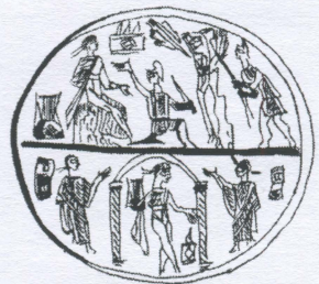
6. Bol de verre avec Apollon et Marsyas (Bonn, Rheinisches Landesmuseum) (dessin de l'auteur)