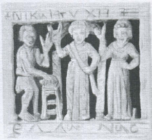
5. Peigne en ivoire d'Helladia (Louvre) (dessin Pia Imbar)