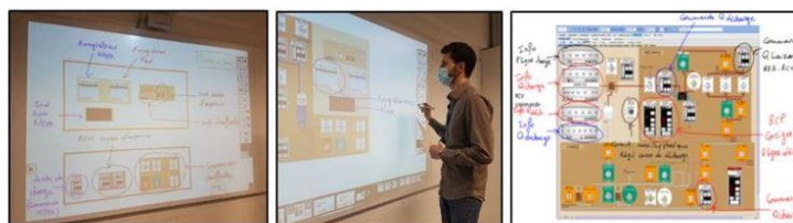
Figure 1 : Photographies de l'atelier pré-maquettage ayant permis l'esquisse des premières maquettes IHM du simulateur d'entraînement

Cet atelier a permis de concevoir un premier niveau de maquettage sur Powerpoint correspondant à des écrans statiques intégrant des fonctions et des principes de dialogue IHM adaptés aux besoins d'entraînements des équipes de conduite.