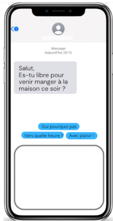
Figure 1: Exemples de scénarios pour la communication entre collègues (au dessus) et entre proches (en dessous) avec la mise en forme utilisée dans les questionnaires distribués aux participants.

Durant la 2ème phase, nous avons sélectionné un échantillon de suggestions qui nous semblaient adéquates. Pour étudier l’acceptabilité des messages, nous avons voulu écarter les suggestions qui poseraient des problèmes de qualité pouvant dissuader les utilisateurs de choisir ces suggestions. Nous avons réalisé une première analyse pour retirer du corpus les messages non efficaces ou inappropriés (incohérence sémantique entre le message et la suggestion, tonalité de la suggestion inappropriée, etc.)