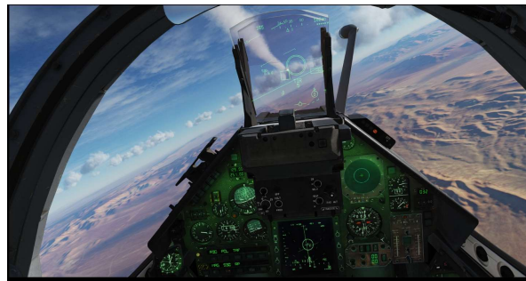
Figure 1: Vue cockpit d'un mirage 2000C dans DCS World.

rentrés ils ne peuvent plus sortir sous peine d'être détruits et donc éliminés. A mesure que le temps s'écoule, la taille de la bulle diminue et rend la survie de plus en plus difficile. Cette spécificité de la bulle est une différence majeure en comparaison d'une activité opérationnelle réelle. Pour gagner, il faut détruire les avions de l'autre équipe. Pour les détruire, plusieurs choix s'offrent aux joueurs : choix de l'avion, choix des missiles, choix de stratégie... La Figure 1 présente la vue disponible à un joueur lors d'un match.