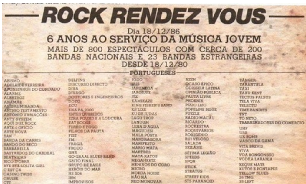
Figure 10 : Affiche rétrospective du 18 décembre 1986