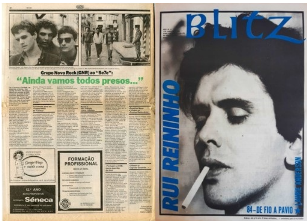
Figure 11 : Un article de Se7e du 15 avril 1981 consacré au groupe GNR et la une de Blitz sur Rui Reininho du 1er janvier 1985