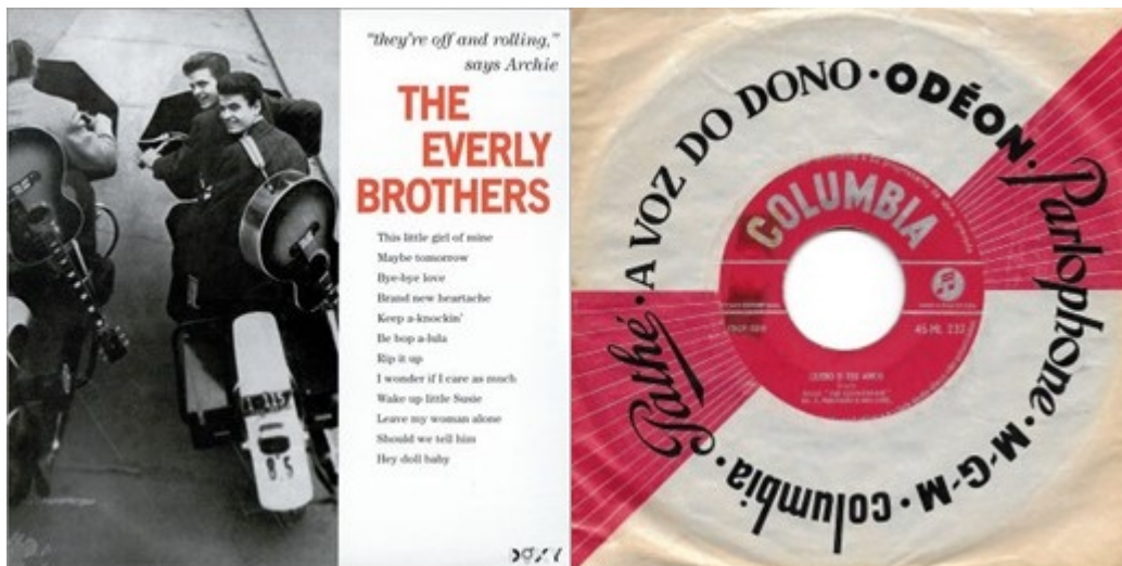
Figure 3 : Le titre « Quero o teu amor » sur la face A du 45 tours est une traduction en portugais de « Should we tell him »