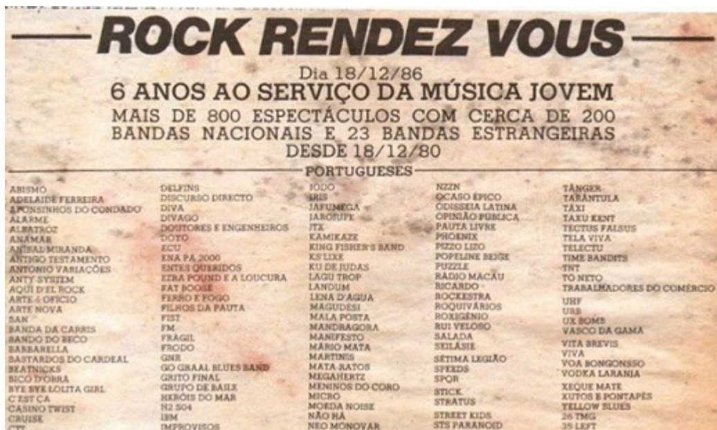
Figure 10 : Affiche rétrospective du 18 décembre 1986