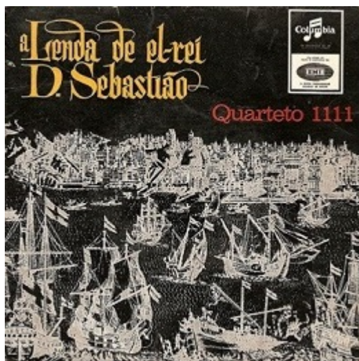
Figure 7 : Pochette du 33 tours A Lenda de el rei D. Sebastião