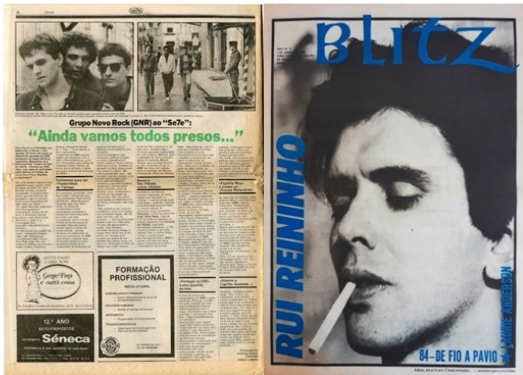
Figure 11 : Un article de Se7e du 15 avril 1981 consacré au groupe GNR et la une de Blitz sur Rui Reininho du 1er janvier 1985