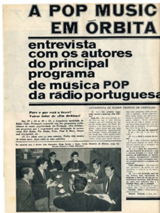
Figure 6 : Première page de l'article de Ruben Tristão de Carvalho paru dans le Século Ilustrado du 14/01/1967.

8 Si le choix éditorial de Em órbita est de faire la promotion de textes écrits en anglais, une exception est faite à cette programmation très anglo-saxonne, lors de la diffusion en 1967 de A Lenda de el rei de D. Sebastião du groupe Quarteto 1111 mené par José Cid 22 . Le caractère réinterprétatif et subversif du mythe de Dom Sebastião de cette composition ne manquera pas de marquer les esprits rebelles 23 .