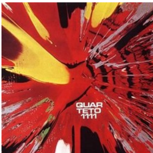
Figure 8 : Pochette du 33 tours Quarteto 1111 .