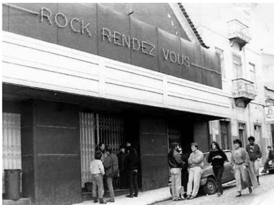
Figure 9 : Photographie de l'entrée de la salle de spectacle Rock Rendez Vous