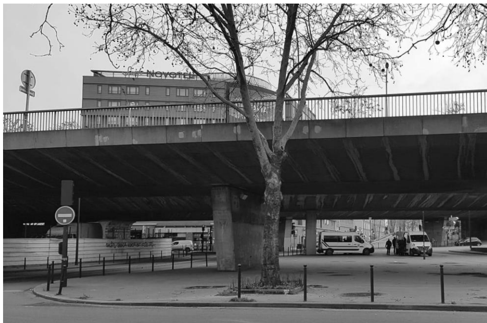
Photo 1. Clôture et présence policière dissuasive à l'échangeur de la Porte de la Chapelle, à Paris. Julie Costa, juillet 2020.

Sa dissolution inaugure une période de déplacements successifs de la scène ouverte entre le 18 e et le 19 e arrondissements, selon la logique de « vases communicants » (Cadet-Taïrou et al., 2021). Dans l'impossibilité de s'y réinstaller, ses occupant·es se déplacent à quelques centaines de mètres à l'est du périphérique, où se construit un nouveau campement