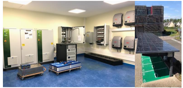
Fig. 2. Plateforme expérimentale – STELLA.

connexion au réseau public, et deux émulateur de charges DC (2x6 kWh) pour émuler les batteries des VE.