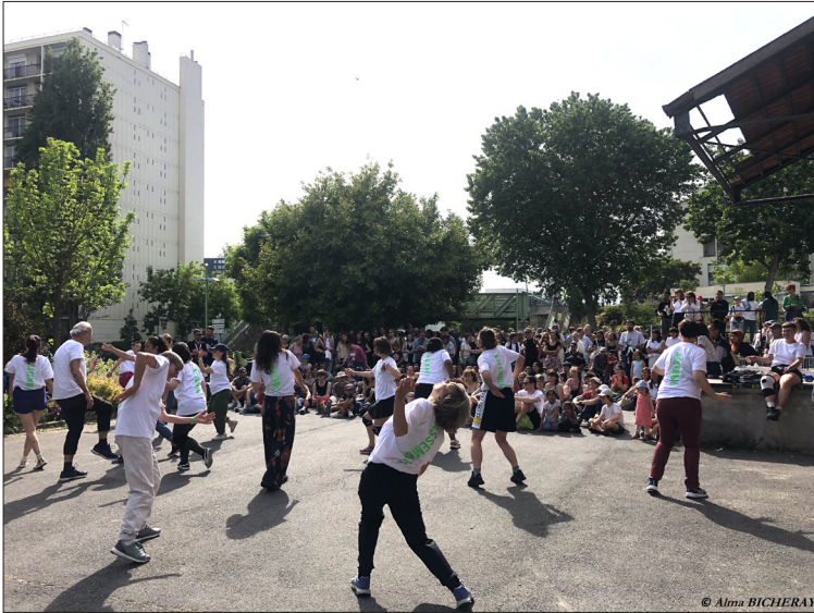
Figure 4. Représentation chorégraphique du projet Assemblé lors de l'événement Un kilomètre de danse à Pantin.