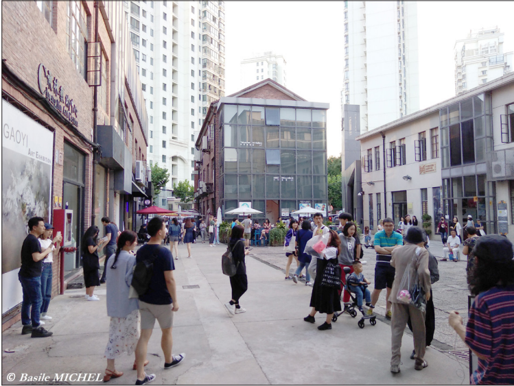
Figure 5. Touristes visitant les lieux d'art du M50   Shanghai.

peut mener à un renforcement de leur attractivit ,   l'instar des quartiers 798   P kin et M50   Shanghai qui s'affirment comme des attractions touristiques de premier rang depuis le milieu des ann es 2000 du fait de l'implantation de nombreux ateliers d'artistes et galeries d'art (figure 5).