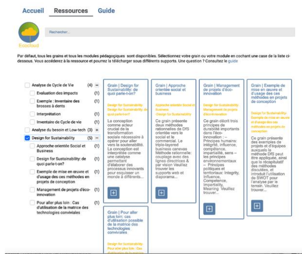
Figure 2 : Architecture des contenus pédagogiques du module Ingénierie Soutenable et Responsable

Les développements de contenus pédagogiques pour une ingénierie durable et responsable (Figure 2) ont été structurés en 14 vidéos et environ 30 sous-modules pour l'apprentissage des étudiants selon des macro-compétences ciblées sur : la pensée systémique, l'analyse du cycle de vie, la limite terrestre, le changement climatique, l'ingénierie soutenable, l'éthique et la responsabilité sociale.