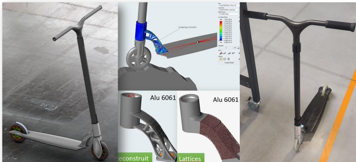
Figure 1 : Détails de la conception d'une trottinette

autonomie et progresser par eux-mêmes jusqu'à la prochaine séance avec les professeurs.