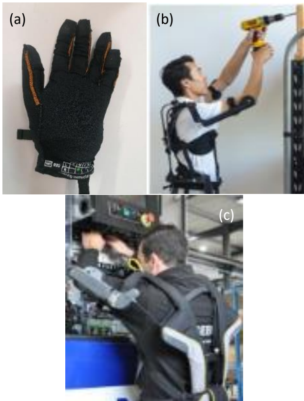
Figure 1 : quelques exosquelettes d'assistance aux gestes : Ironhand (objet de l'étude), SuitX, Ergosquelette de Gobio Robot

L'amélioration des conditions de travail et la prévention des Troubles-Musculo-Squelettiques (TMS) a permis aux exosquelettes de prendre peu à peu leur place en industrie. Ils sont généralement passifs (Figure 1b et 1c) voire actifs (Figure 1a) et permettent d'assurer une assistance aux gestes professionnels [1].