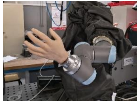
Figure 6 : Installation de la main sur un robot collaboratif