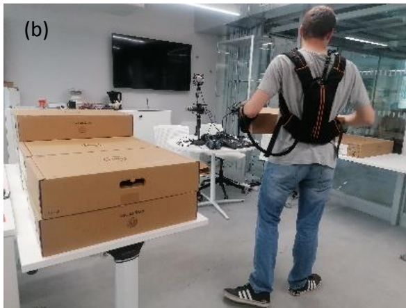
Figure 2 : Activité de vissage/dévisage à différentes hauteurs (a) ; Activité de transports de charge (b)

Les exercices à réaliser ont été définis avec les applications préconisées par Bioservo. Les applications de l'IronHand concernent l'utilisation d'outils à guidage manuel, l'entreposage, la manipulation de charges lourdes. Le premier exercice consiste, avec une perceuse, à visser 10 vis à différents niveaux sur une planche en bois puis de les dévisser. Cet exercice permet d'avoir une tâche répétitive avec un besoin de force de préhension pour maintenir la perceuse (Figure 2a). Le deuxième exercice consiste à déplacer 10 cartons d'une masse d'environ 10kg d'une table à une autre environ espacé de 2 mètres. Cet exercice permet d'avoir une tâche d'entreposage répétitive (Figure 2b).