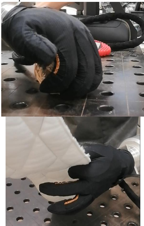
Figure 5 : test de préhension d'objets : balle, tissus

Ces travaux ont permis également de réfléchir à un préhenseur multi-pièce basé sur le gant IronHand. L'acquisition d'une main en silicone fixée en bout de robot a permis de faire des essais de préhension d'objets (Figure 5). La difficulté de positionnement de la main au regard de l'objet nous pousse à développer des algorithmes d'estimation de poses de main à partir de la bibliothèque OpenCV [14]. Ces travaux s'inscrivent dans un ensemble de recherche traitant de l'apprentissage par imitation (Figure 6) et plus globalement du projet ANR AIBY4 visant deux axes applicatifs – Industrie du futur et Santé du futur – et deux axes plus théoriques – IA par les humains et IA pour les humains.