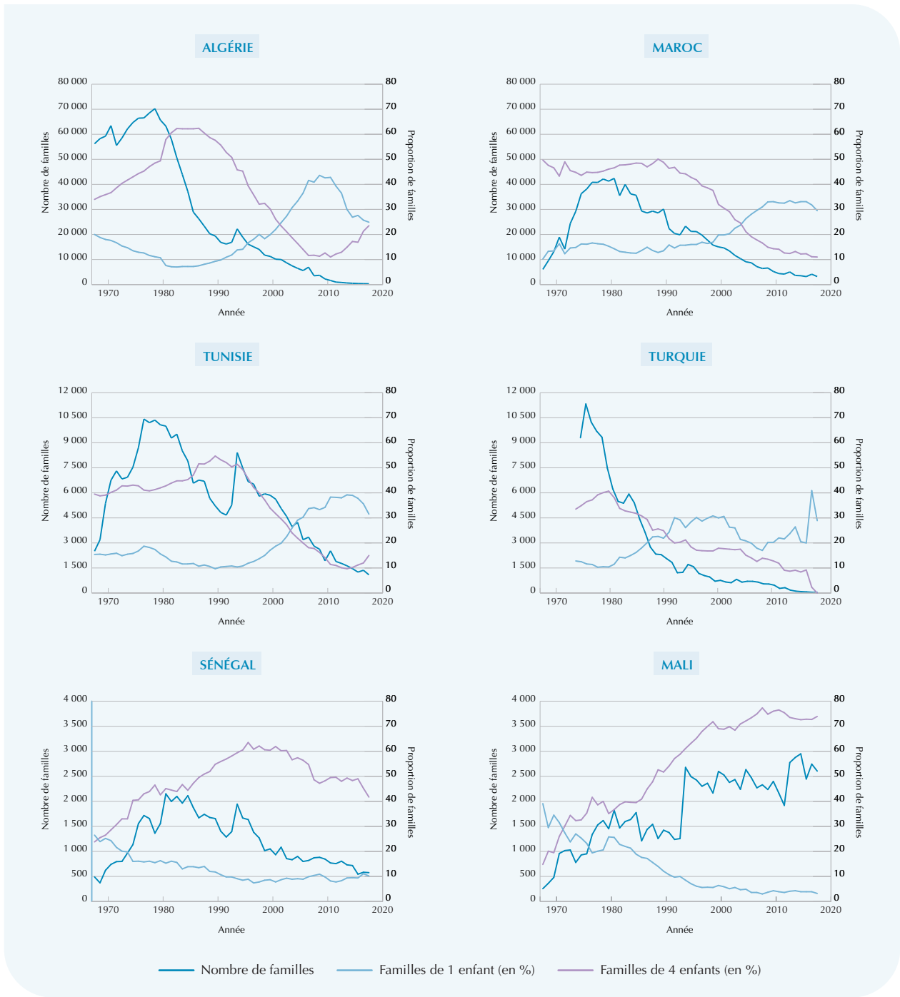
Graphique 1 – Nombre et composition des familles bénéficiaires des prestations familiaales à l'étranger selon la nationalité du parent résidant en France, 1968 – 2018