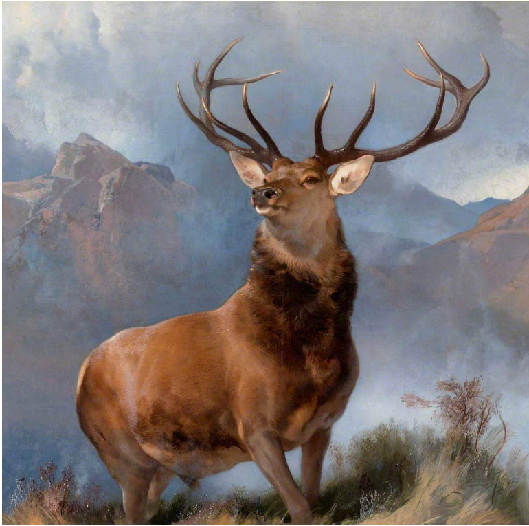
Figure 12. Edwin Landseer. The Monarch of the Glen (1851).

possèdent un système émotionnel (Chapouthier, 2020, p. 38) indépendamment des projections anthropomorphiques.