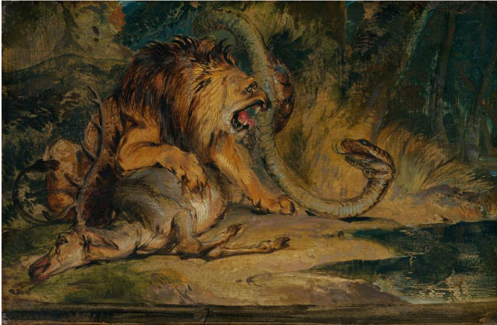
Figure 8. Edwin Landseer. Lion Defending its Prey (1840).