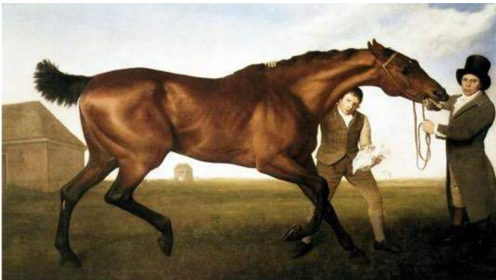
Figure 5. George Stubbs. Hambletonian Rubbing Down (1800).