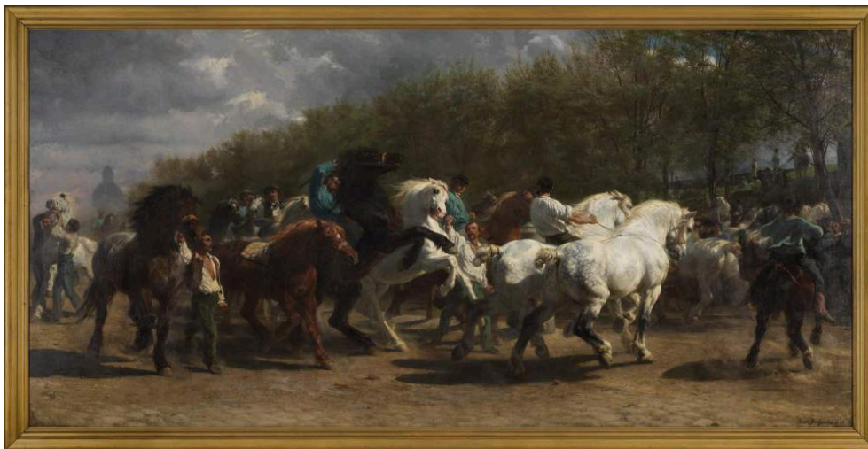
Figure 11. Rosa Bonheur. Le Marché aux chevaux (1853).