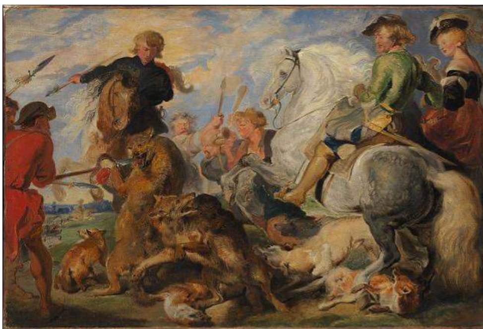
Figure 7. Edwin Landseer. D'après « Chasse au loup et au renard », de Rubens (1824).