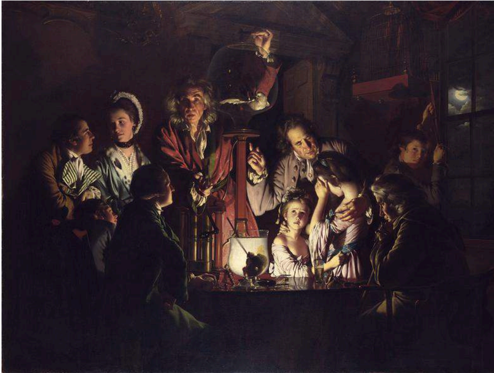
Figure 1. Joseph Wright of Derby. An Experiment on a Bird in the Air-Pump (1768).