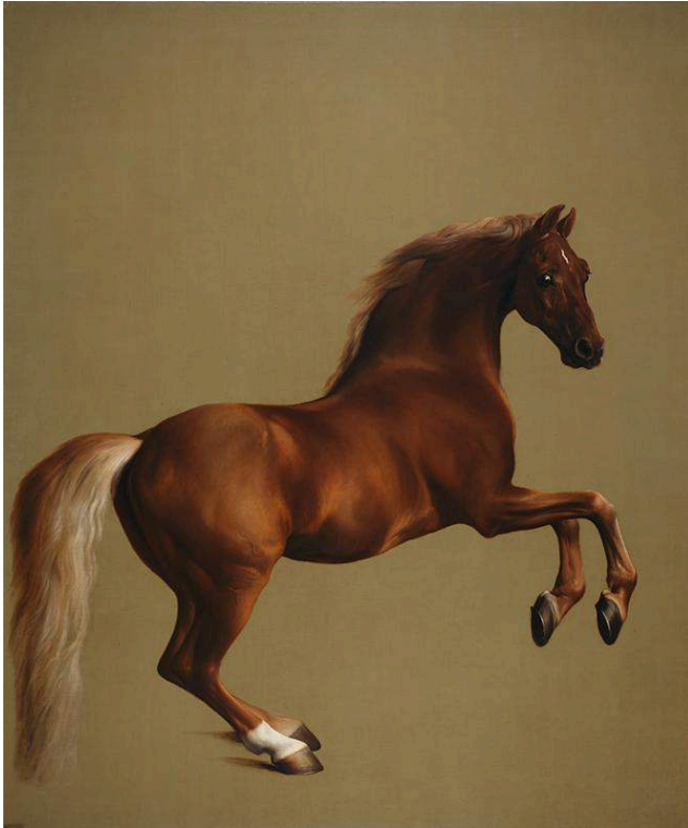
Figure 6. George Stubbs. Whistlejacket (c. 1762).

Hambletonian, Rubbing Down (1799-1800) [Figure 5], il ne reste que quelques symptômes des émotions de la course terminée, symptômes que l'on peut observer dans le frisson intense qui parcourt la silhouette du cheval, depuis les oreilles rabattues, avec le cou tendu, jusqu'à la queue dressée, sans oublier la gueule ouverte dans un cri, comme pour suggérer combien la victoire fut éreintante pour le cheval – et par conséquent éclatante pour son propriétaire qui a aussi commandité le tableau. Les deux palefreniers, dans des tenues élégantes, fixent le spectateur d'un air serein, voire blasé : ce n'est sans doute pas leur première course, et ils n'ont cure des émotions de l'animal.