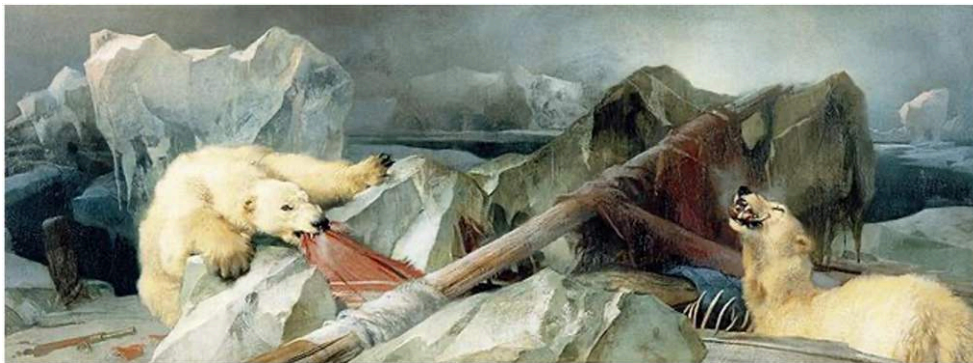
Figure 9. Edwin Landseer. Man Proposes, God Disposes (1864).

To allow Landseer a closer look at the cattle, a decision was made to shoot one of the bulls. A keeper was placed in ambush beside a gate, which he was to shut on one of the bulls when the main herd went through. The plan went wrong, the keeper was thrown by the angry bull, and his life was saved only by the prompt action of Ossulton's deerhound, Bran, which held the bull off the body. Ossulton recorded that : 'Of course the bull was forthwith shot, and together with Bran and the other personages concerned, was the subject of Landseer's picture of the « Dead Bull ».' (Ormond, 1981, p. 126) 6 .