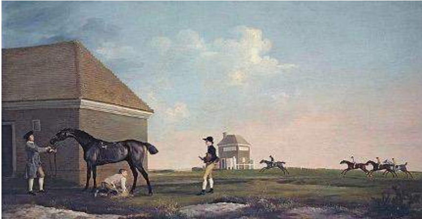
Figure 4. George Stubbs. Gimcrack on Newmarket Heath, with a Trainer-Jockey and a Stable-Lad (1765).

principal le bien-être de l'animal : il s'agit avant tout de l'entretenir et de le préparer pour une course ou une chasse à courre.