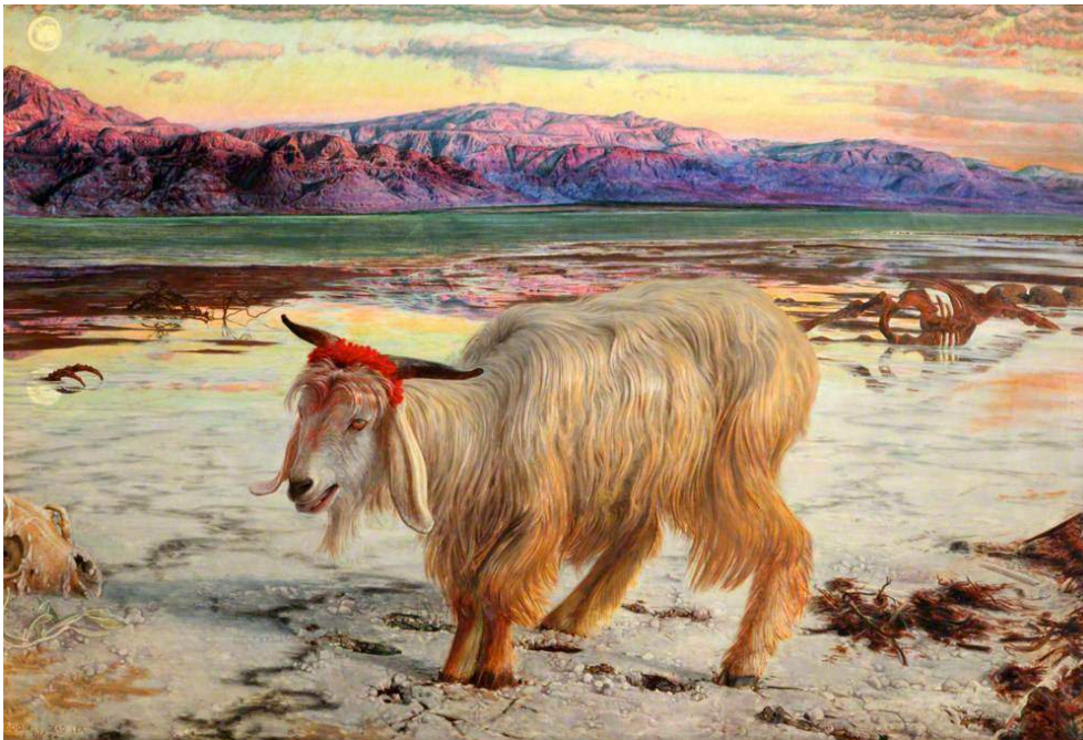
Figure 14. William Holman Hunt. The Scapegoat (1854-1856).