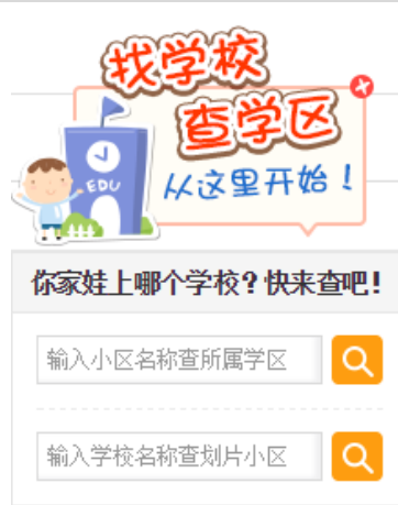
1. Moteur de recherche d'école ( house365.com , consulté le 01/11/2015, version pour la ville de Changzhou)

Le moteur de recherche visible dans l'illustration 1 attire l'attention par un slogan : « Chercher une école, explorer les quartiers scolaires, par où commencer ? », « Dans quelle école va aller votre bébé ? Venez vite chercher ! » Les deux zones de recherches permettent alternativement de trouver une école à partir d'un quartier résidentiel ou l'inverse.