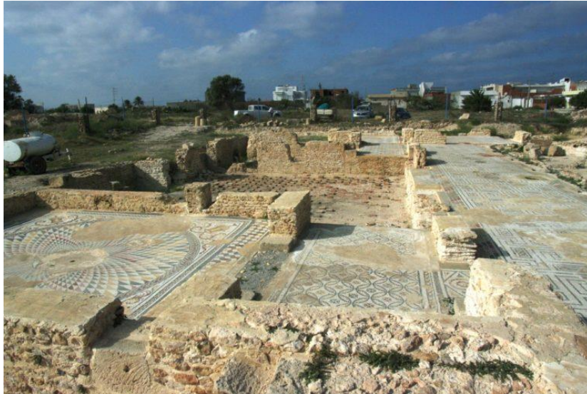
Figure 4 : la ville antique de Thapsus

L'ancienne ville, qui était occupée jusqu'à la période byzantine du moins, couvre seulement environ 40 hectares et son plan d'urbanisme est inconnu. Seuls les vestiges immergés de son port et quelques monuments romains restent dans le paysage contemporain : citernes, amphithéâtre, bains, magasins, pour les principaux (Fig.4).