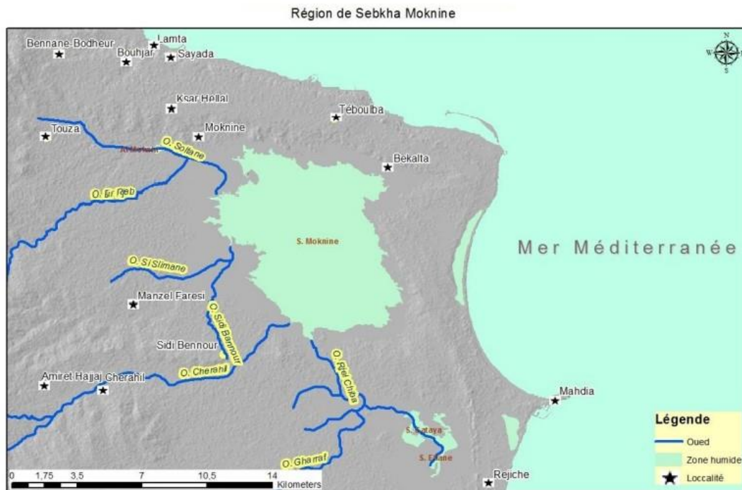
Figure1. Site d'étude : la Sebkhia Moknine est son réseau hydrographique. Extrait de la carte topographique Moknine 1/250 000 (Chairi, 2021)

par une couche de sel. En hiver, en période de pluie, elle se remplit partiellement sans jamais dépasser toutefois la cote -9m. Encore, cette cote est atteinte le plus souvent par l'effet du vent qui sur le fond très plat du bassin, arrive à pousser l'eau de la partie centrale vers la périphérie sur des distances considérables (Chairi, 2005, Chairi et Abdeljaoued 2019).