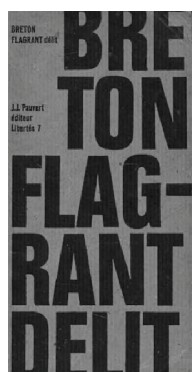
André Breton, Flagrant délit , Paris, J.-J. Pauvert, « Libertés » n° 7, 1964 (couverture de Pierre Faucheux)

Poche pendant plusieurs années. Ses couvertures sont d'une inventivité folle : photocollages, compositions typographiques, réutilisation de documents d'archives, chartes graphiques à fond blanc plus fonctionnalistes (les Points Seuils), cherchant toujours « l'attendu : la couverture inattendue ».