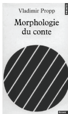
Vladimir Propp, Morphologie du conte , Paris, Le Seuil, « Points », 1970 (couverture de Pierre Faucheux)

ÉS – Enfin, vous est-il possible d'identifier aujourd'hui de nouvelles tendances, en lien sans doute avec « l'instagrammisation » des livres ? Votre