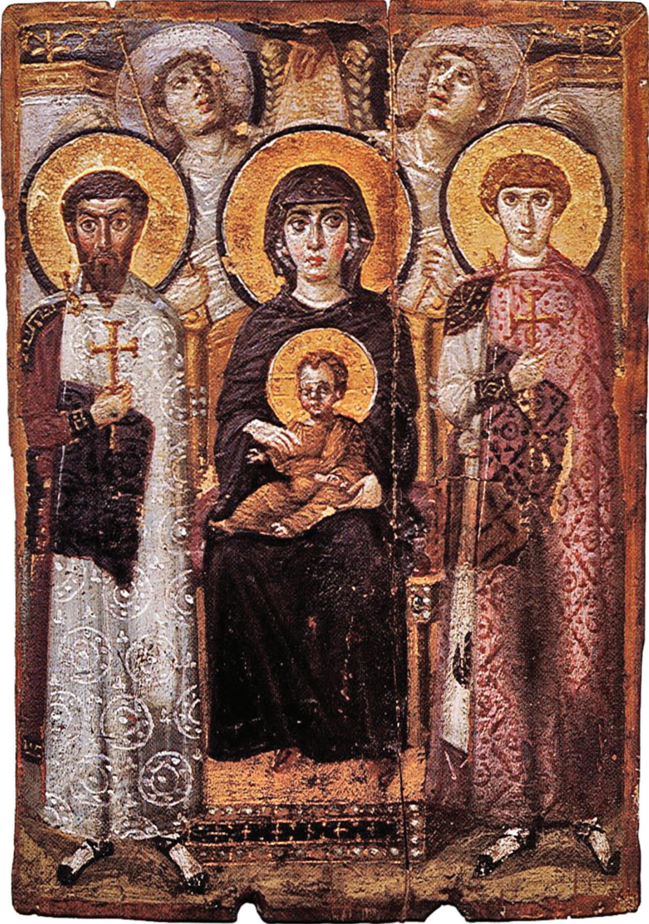
Fig. 6 – Icône à l'encaustique sur panneau de bois, 685 × 497 mm, Sinaï, VI e -VII e siècle, Monastère Sainte-Catherine du Sinaï. La Vierge à l'Enfant entourée par deux anges, saint Théodore Stratilate et saint Georges – ill. tirée de Byzantium and Islam (cité n. 5), p. 127, fig. 55.