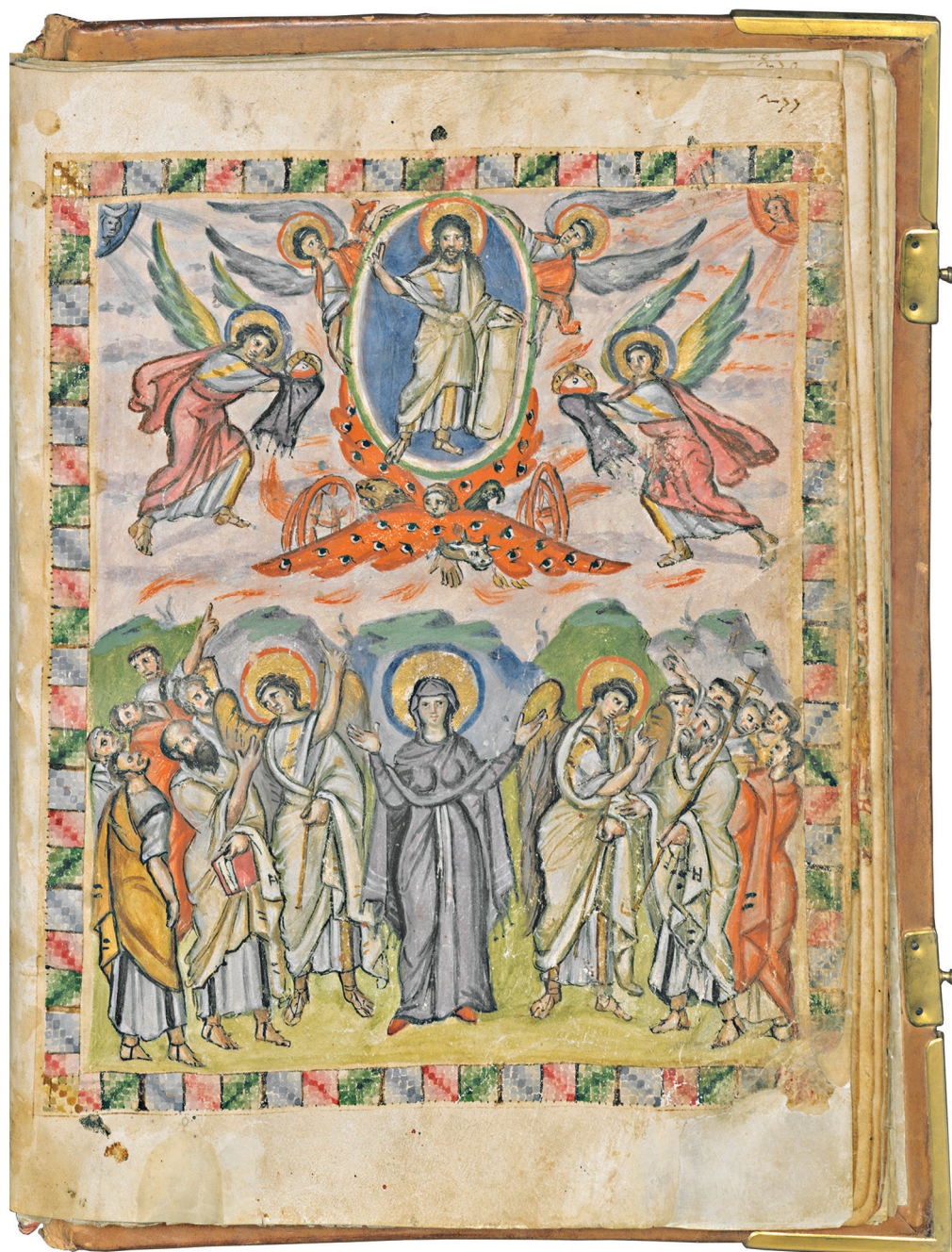
Fig. 1 – Florence, BML, Cod. Plut. I 56, f. 13v. Parchemin, encre, or et pigments, Syrie-Mésopotamie, c. 525-550. L'Ascension – ill. tirée de PACHA MIRAN, Le décor de la Bible syriaque de Paris (cité n. 4), p. 246, fig. 72.