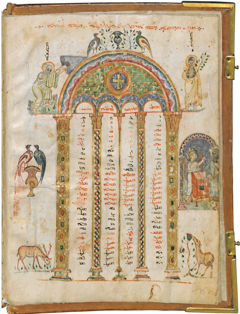
Fig. 8 – Florence, BML, Cod. Plut. I 56, f. 3v. Parchemin, encre, or et pigments, Syrie-Mésopotamie, c. 525-550. Tables de canons et Annonce à Zacharie – ill. tirée de PACHA MIRAN, Le décor de la Bible syriaque de Paris (cité n. 4), p. 238, fig. 64.