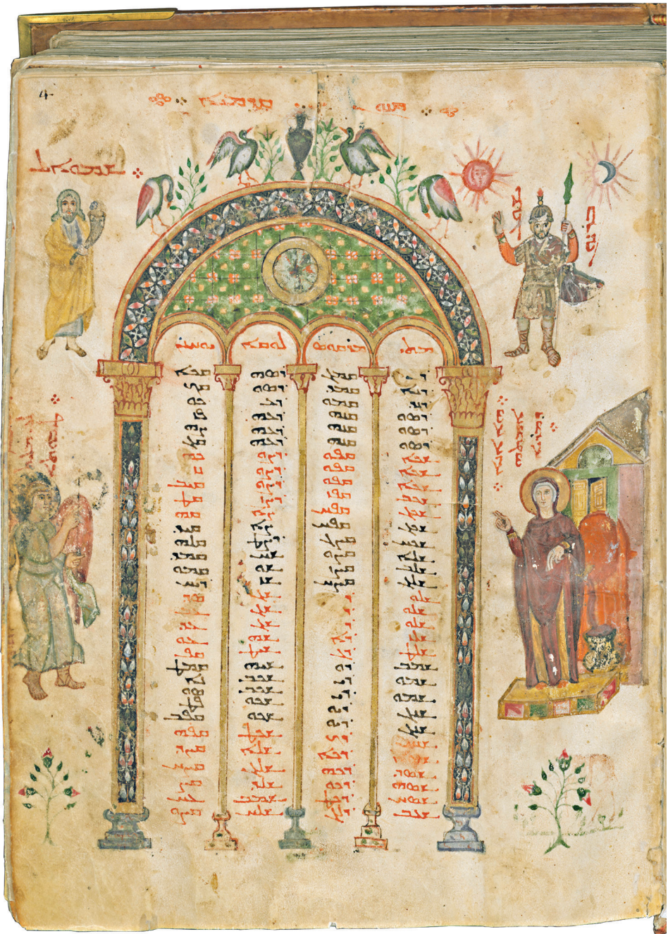
Fig. 7 – Florence, BML, Cod. Plut. I 56, f. 4r. Parchemin, encre, or et pigments, Syrie-Mésopotamie, c. 525-550. Tables de canons et Annonciation – ill. tirée de PACHA MIRAN, Le décor de la Bible syriaque de Paris (cité n. 4), p. 239, fig. 65.