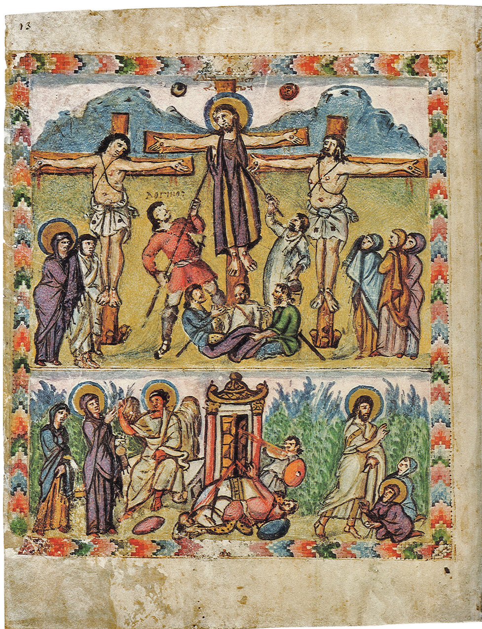
Fig. 5 – Florence, BML, Cod. Plut. I 56, f. 13r. Parchemin, encre, or et pigments, Syrie-Mésopotamie, c. 525-550. La Crucifixion et l'Annonce de la Résurrection – ill. tirée de The Rabbula Gospels. Facsimile edition of the miniatures of the Syriac Manuscript Plut. I, 56 in the Medicean-Laurentian Library , ed. by C. Cecchelli, J. Furlani, and M. Salmi, Olten – Lausanne 1959, pl. 13a.