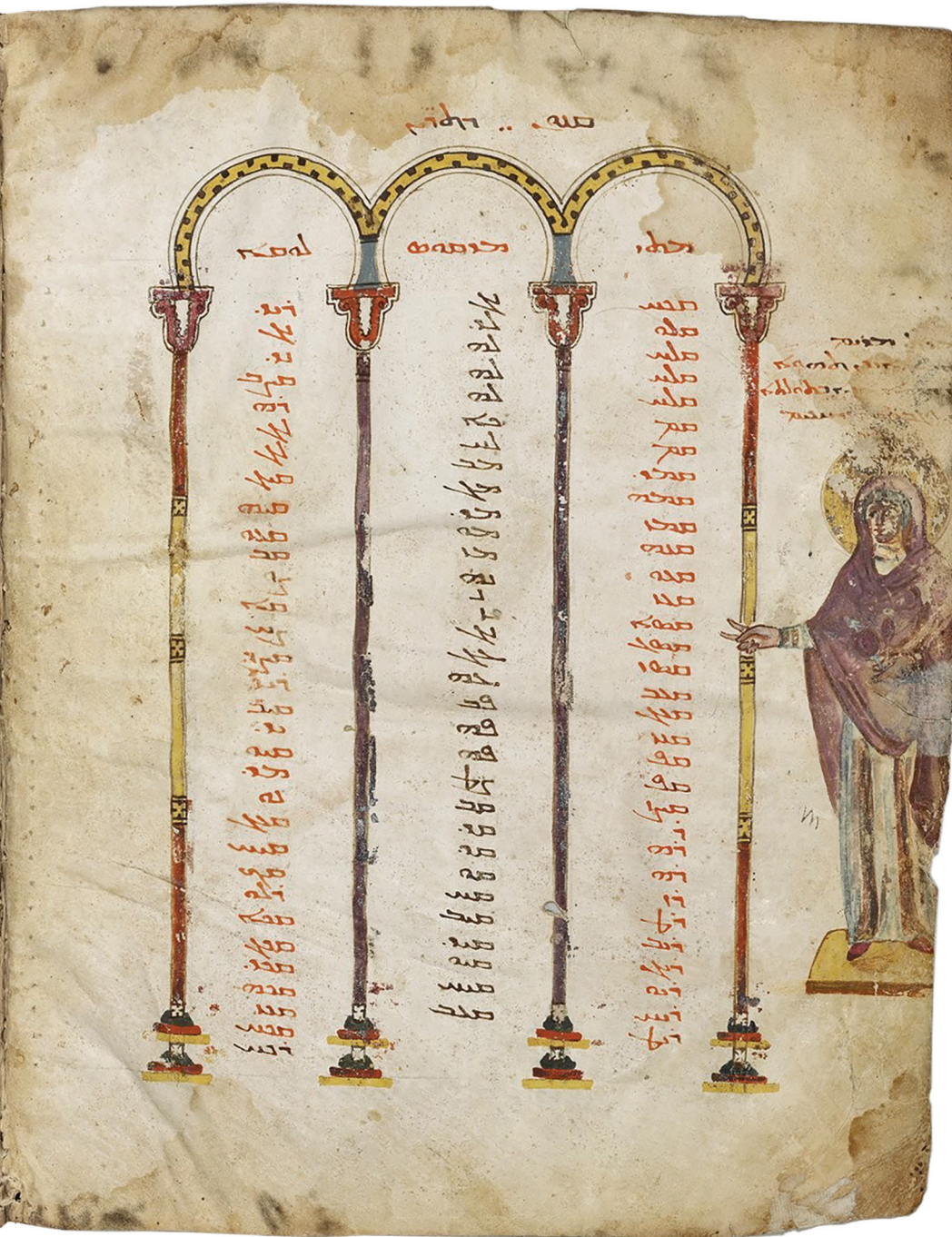
Fig. 9 – Paris, BnF, ms. syr. 33, f. 3v-4r. Parchemin, encre et pigments, Haute-Mésopotamie, fin du VI e siècle. Tables de canons et Annonciation – © gallica.bnf.fr / Bibliothèque nationale de France.