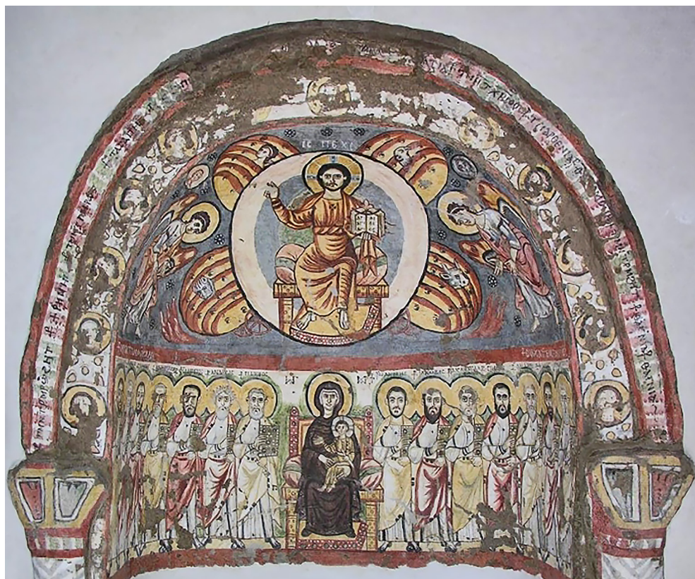
Fig. 3 – Baouit, monastère d'Apa Apollô, salle 6, mur est, VI e -VII e siècle. L'Ascension. Le Caire, Musée copte, Inv. 7118 – domaine public, photographie par Heather Badamo, avec la permission de l' © American Research Center in Egypt.