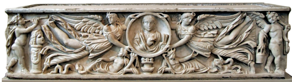
Fig. 2 – Sarcophage, marbre, 460 × 810 × 535 mm, deuxième quart du III e siècle. Moscou, Musée Pouchkine, Inv. II 1a 761. Portrait du défunt porté par des génies ailés – photographie de I. A. Shurygin, dans Античная скульптура из собрания Государственного музея изобразительных искусств имени А. С. Пушкина , Moskva 1987, p. 148, n° 92.