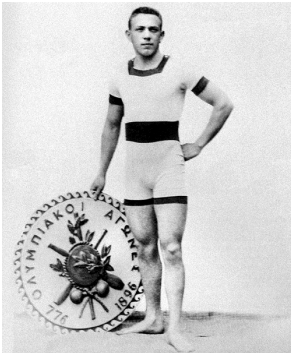
Alfréd Hajós lors des J.O. d'Athènes en 1896 (photographe inconnu).